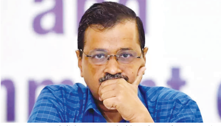
डाला गया। इसी मामले में डिप्टी सीएम सिंसोदिया और आप के राज्यसभा सांसद

इस मामले में केजरीवाल की गिरफ्तारी भारत में पहली घटना है जहां एक मौजूदा मुख्यमंत्री को सलाखों के पीछे