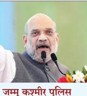
जम्मू कश्मीर पुलिस को सौंपा जाएगा कानून व्यवस्था का भार

केंद्रीय गृहमंत्री अमित शाह का कहना है कि केंद्र सरकार जम्मू-कश्मीर में सशस्त्र बल अधिनियम को हटाने पर विचार करेगी। एक साक्षात्कार के दौरान उन्होंने कहा कि सरकार वहां से सैनिकों को वापस बुलाने और कानून व्यवस्था को अकेले जम्मू-कश्मीर पुलिस पर छोड़ने की योजना बना रही है। उन्होंने कहा कि पहले जम्मू-कश्मीर पुलिस पर भरोसा नहीं किया जा सकता था लेकिन अब वे विभिन्न ऑपरेशन का नेतृत्व कर रहे हैं। बता दें, एएफएसपीए (अफसपा) सशस्त्र बलों के उन जवानों को अधिकार देता है, जो अशांत क्षेत्रों में काम कर रहे हैं कि अगर सार्वजनिक व्यवस्था के रखरखाव के लिए उन्हें जरूरत पड़ती है तो वे तालाशी, गिरफ्तारी और गोली चला सकते हैं। सशस्त्र बलों के संचालन को सुविधाजनक बनाने के लिए अफसपा के तहत किसी क्षेत्र या जिले को अशांत घोषित किया जाता है। साक्षात्कार के दौरान, शाह ने विपक्षी नेता फारूक अब्दुल्ला और महबूबा मुफ्ती पर निशाना साधा। शाह ने कहा कि दोनों नेताओं पर आतंकवाद पर बोलने का अधिकार नहीं है। जितनी फर्जी मुठभेड़ों उनके समय में हुई हैं, इतनी कभी नहीं हुई हैं। पिछले पांच वर्षों में एक भी फर्जी मुठभेड़ नहीं हुई। बल्कि फर्जी मुठभेड़ों में शामिल लोगों के खिलाफ एफआईआर दर्ज की गई है। हम कश्मीर के