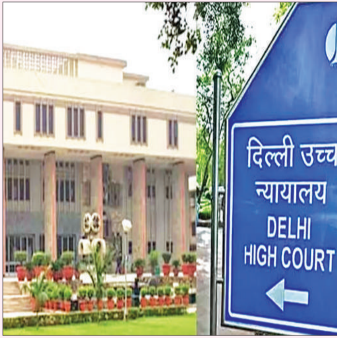
ने संविधान के अनुच्छेद 163 और 164 का हवाला देते हुए दावा किया है कि एक कैदी केजरीवाल को मुख्यमंत्री के रूप में अपने कर्तव्यों और जिम्मेदारियों को पूरा करने में अक्षम बनाती है।