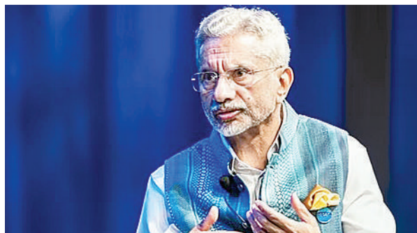
'भारतवासियों के प्रति मेरा पहला कर्तव्य सीमा की सुरक्षा करना है। मैं इस पर कभी समझौता नहीं कर सकता।' उन्होंने प्रवासी भारतीयों

विदेश मंत्री ने कहा कि बीजिंग के साथ संबंधों को आगे बढ़ाने के लिए भी यही शर्त होगी। जयशंकर ने मलेशिया की राजधानी कुआलालंपुर में कहा,