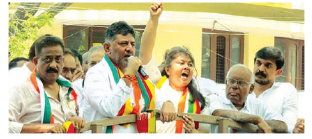
राज्य में अब तक 59 उम्मीदवारों ने दाखिल किया नामांकन पत्र @ नम्मा बेंगलूरु

Postal Regd.No. HQ/SD/523/2023-25 | मंगलवार, 02 अप्रैल, 2024 | हैदराबाद और नई दिल्ली से प्रकाशित | epaper.shubhlabbhdaily.com | संपादक : गोपाल अग्रवाल | पृष्ठ : 14 | * मूल्य-6 रु. | वर्ष-6 | अंक-92