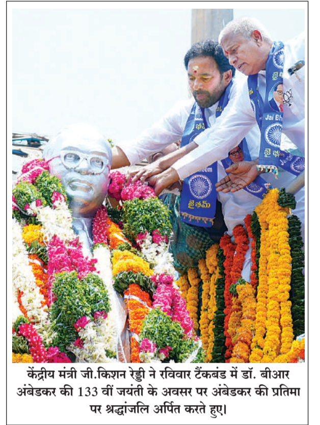
केंद्रीय मंत्री जी.किशन रेड्डी ने रविवार टैंकबंद में डॉ. बीआर अम्बेडकर की 133 वीं जयंती के अवसर पर अम्बेडकर की प्रतिमा पर श्रद्धांजलि अर्पित करते हुए।

यहां उनकी विरासत और राष्ट्र के लोगों पर पड़े उसके स्थायी प्रभाव के प्रति अपना सम्मान प्रकट करने के लिए एकत्र हुए हैं। मैं अपनी सुस्थिर व्यावसायिक प्रथाओं, कौशल विकास पहलों और सामुदायिक जुड़ाव कार्यक्रमों पर गर्व अनुभव करता हूँ जो वंचित लोगों के जीवन में मूर्त रूप से अंतर लाते हैं। अम्बेडकर जयंती के अवसर पर एनएमडीसी ने अपने कॉर्पोरेट कार्यालय, हैदराबाद में एक सांस्कृतिक कार्यक्रम का आयोजन किया और बच्चों को स्कूल बैग वितरित किए। उनके जीवन से प्रेरणा लेते हुए, एनएमडीसी में हम उनकी शिक्षाओं को स्वीकार करते हैं और एक ऐसे भारत के निर्माण के प्रति समर्पित हैं जो सभी भारतीयों के लिए समान रूप से समृद्ध हो, एक ऐसा भारत जिसका डॉ. अम्बेडकर ने स्वयं देखा था और प्रयास किया था।