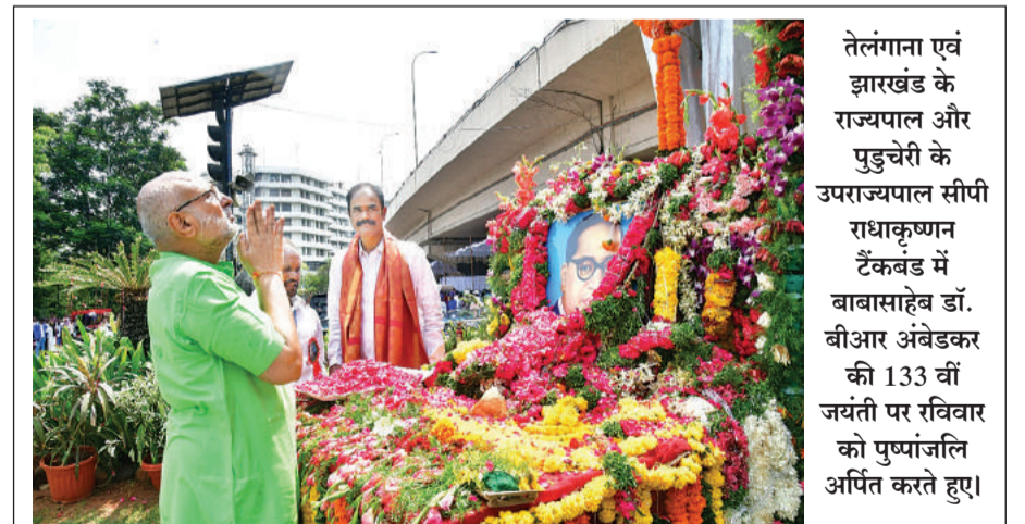
तेलंगाना एवं झारखंड के राज्यपाल और पुडुचेरी के उपराज्यपाल सीपी राधाकृष्णन टैंकबंद में बाबासाहेब डॉ. बीआर अम्बेडकर की 133 वीं जयंती पर रविवार को पुष्पांजलि अर्पित करते हुए।