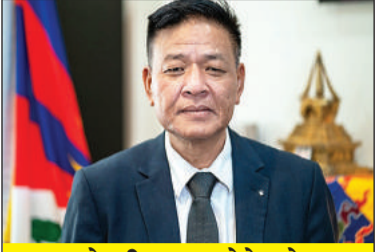
भारत से भी मुखर होने को कहा

भारत के धर्मशाला में चल रही तिब्बत की निर्वासित सरकार सेंट्रल तिब्बतन एडमिनिस्ट्रेशन (सीटीए) के प्रधानमंत्री पेंपा शेरींग ने चीन के साथ अनौपचारिक बातचीत चलने की पुष्टि की है। उन्होंने बताया कि उनके वार्ताकार चीन के लोगों से बात कर रहे हैं, लेकिन अभी इस बातचीत से कोई नतीजा निकलने की उम्मीद करना गलत है। शेरींग ने बताया कि हम बीते साल से पदों के