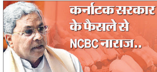
कर्नाटक सरकार के फैसले से NCBK नाराज..

रामायण टीवी धारावाहिक में भगवान राम का किरदार