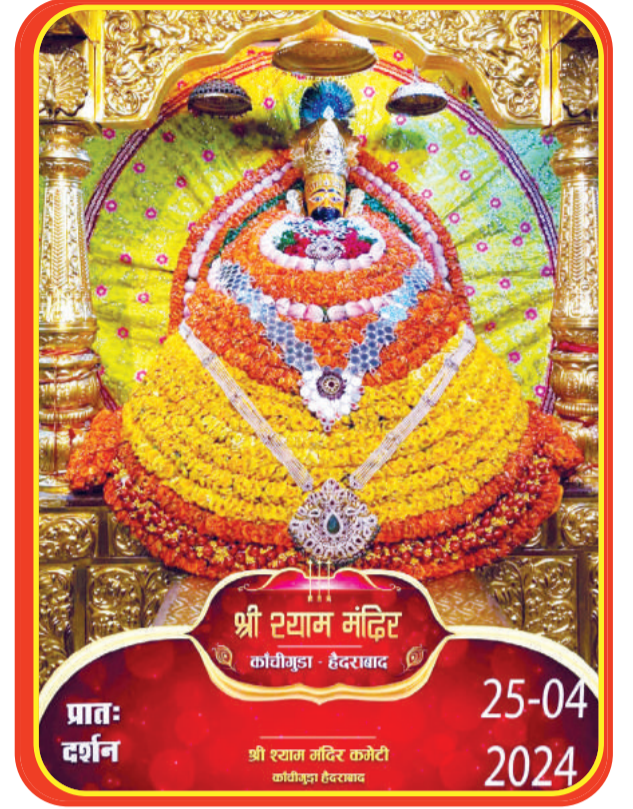
श्री श्याम मंदिर काटीपुडा - हैदराबाद प्रातः दर्शन 25-04-2024 श्री श्याम मंदिर काटीपुडा काटीपुडा हैदराबाद