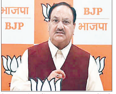
कि अल्पसंख्यकों, खासकर मुसलमानों को प्राथमिकता दी जानी चाहिए और देश में संसाधनों पर पहला अधिकार उनका होना चाहिए। भाजपा अध्यक्ष ने आरोप लगाया कि कांग्रेस एससी/एसटी और ओबीसी लोगों से नफरत करती है क्योंकि देश में अधिकांश आबादी उनमें शामिल है।

नई दिल्ली, 26 अप्रैल (एजेंसियां)। भारतीय जनता पार्टी (भाजपा) अध्यक्ष जेपी नड्डा ने शुरुवार को तृष्टिकरण की राजनीति को लेकर कांग्रेस की तीखी आलोचना की और कहा कि वह अनुसूचित जाति/जनजाति (एससी/एसटी) और अन्य पिछड़ा वर्ग (ओबीसी) लोगों के अधिकार छीनकर मुसलमानों को देना चाहती है।