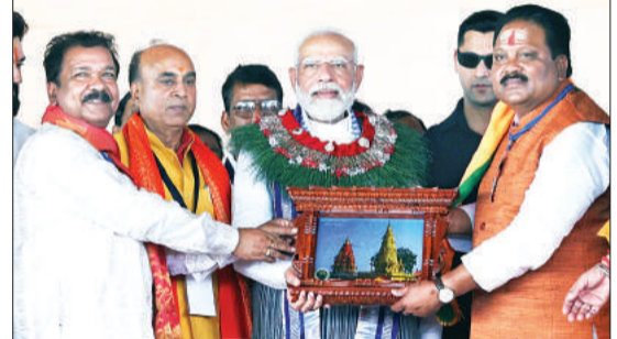
बाबरी मस्जिद के पक्षकार थे, लेकिन प्राण-प्रतिष्ठा में हाजिर हुए राजद-इंडी ने न्यौता भी ठुकाराया और राम को भी ठुकरा दिया

पटना, 26 अप्रैल (एजेंसियां)। प्रधानमंत्री नरेंद्र मोदी ने बिहार के मुंगेर में जनसभा के दौरान कांग्रेस पर हमला करते हुए अयोध्या के श्रीराम मंदिर का भी जिक्र किया। उन्होंने राम मंदिर के निमंत्रण को ठुकराने के लिए कांग्रेस और लालू प्रसाद यादव की पार्टी राष्ट्रीय जनता दल पर सीधा हमला तो किया, लेकिन इसी की चर्चा के दरम्यान पीएम मोदी ने इनसे बेहतर बाबरी मस्जिद के पक्षकार अंसारी परिवार को बताया।