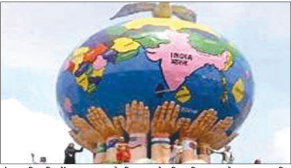
संयुक्त विज्ञापन में कहा गया है कि एससीओ देशों ने अन्य पहलों के साथ