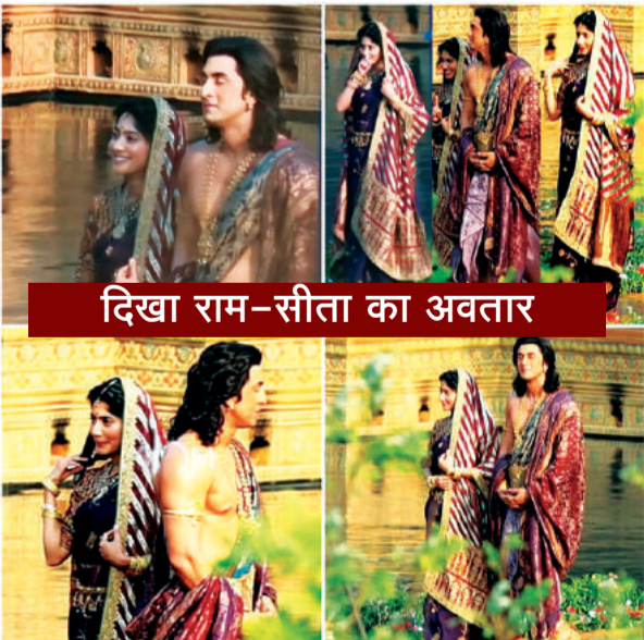
दिखा राम-सीता का अवतार

फिल्म रामायण इन दिनों सुर्खियों में है। यह फिल्म इसलिए भी चर्चा में है, क्योंकि इसे काफी बड़े स्तर पर बनाया जा रहा है और कई बड़े सितारे इससे जुड़े हैं। यही वजह है कि फिल्म से जुड़ी हर छोटी-बड़ी जानकारी पर प्रशंसक नजर नाए हुए हैं।अब नितेश तिवारी के निर्देशन में बन रही इस फिल्म में भगवान श्रीराम बने रणबीर कपूर और माता सीता के अवतार में साई पल्लवी की पहली झलक सेट से लीक हो गई है।फिल्म के सेट से रणबीर और साई की कुछ तस्वीरें सामने आई हैं, जिनमें उन्हें भगवान राम और मां सीता के अवतार में देखा जा सकता है। इन तस्वीरों ने आते ही सोशल मीडिया पर तहलका मचा दिया है।दोनों का लुक लोगों को खूब भा रहा है। तस्वीरों को देख लग रहा है कि ये राम और सीता की शादी के बाद वाला सीन है। पोशाक के साथ रणबीर और साई के हाव-भाव भी देखने लायक हैं।इस फिल्म से कई सितारों का नाम जुड़ा है। केजीएफ स्टार यश इससे बतौर सह-निर्माता जुड़े हैं, वहीं वह इसमें रावण की भूमिका भी निभाने वाले हैं।सनी देओल