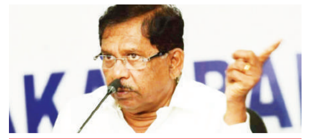
पेन ड्राइव मामले में महिलाओं को ब्लैकमेल किया तो होगी सख्त कार्रवाई : परमेश्वर @ नम्मा बेंगलूर