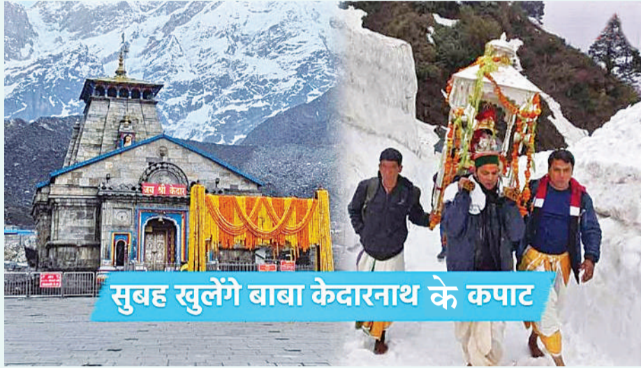
सुबह खुलेंगे बाबा केदारनाथ के कपाट

केदारनाथ उत्तराखंड राज्य में स्थित हिंदुओं के लिए सबसे पवित्र तीर्थस्थलों में से एक है। भगवान शिव को समर्पित केदारनाथ मंदिर 12 ज्योतिर्लिंगों में से एक है। केदारनाथ मंदिर के कपाट हर साल अक्षय तृतीया के दिन खोले जाते हैं। इस बार कपाट खुलने से पहले केदारनाथ मंदिर को भव्य तरीके से सजाया जा रहा है। बाबा केदार की पैदल डोली यात्रा भी गौरीकुंड से केदारनाथ के लिये रवाना हो चुकी है। डोली में भगवान शिव की पिंडी स्थापित होती है। डोली को कंधे पर उठाकर श्रद्धालु केदारनाथ तक ले जाते हैं। डोली यात्रा हिंदुओं के लिए बहुत ही पवित्र माना जाता है। श्रद्धालु इस यात्रा को जीवन में एक बार जरूर करना चाहते हैं। बाबा केदार की डोली केदारनाथ पहुंचने के बाद मंदिर के गर्भगृह में