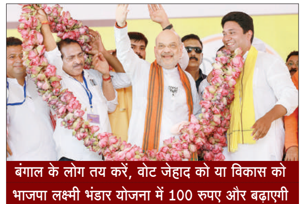
बंगाल के लोग तय करें, वोट जेहाद को या विकास को भाजपा लक्ष्मी भंडार योजना में 100 रुपए और बढ़ाएगी

हावड़ा, 15 मई (एजेंसियां)। पश्चिम बंगाल के हावड़ा जिले के उलूबेरिया में भारतीय जनता पार्टी के वरिष्ठ नेता एवं केंद्रीय गृहमंत्री अमित शाह ने मुख्यमंत्री ममता बनर्जी पर तीखा हमला बोला। उन्होंने कहा कि ममता बनर्जी के लिए घुसपैटिए और रोहिंग्या वोटबैंक हैं। उनका नारा अब मुल्ला, मद्रसा और माफिया हो गया है और पश्चिम बंगाल अब बांग्लादेशी और रोहिंग्या घुसपैटियों का हो गया है। अमित शाह ने कहा, ममता बनर्जी ने घुसपैटियों को खुली छूट दे रखी है। बांग्लादेश से आने वाले घुसपैटियों को खुश करने के लिए ममता बनर्जी सीए का विरोध कर रही हैं। मैं आपको विश्वास दिलाता हूँ, ममता दीदी को जितना विरोध करना है, वो करें। एक-एक