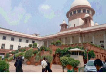
मामले में इंडी ने किसी आरोपी को गिरफ्तार किए बिना चार्जशीट दाखिल की और अदालत ने इस पर संज्ञान लेकर उसे समन किया तो ऐसे व्यक्ति को पीएमएलए के तहत जमानत के लिए दोहरा शर्तों को पूरा करने की आवश्यकता नहीं है। पीएमएलए को पूर्व प्रधानमंत्री अटल बिहारी वाजपेयी की सरकार के दौरान 2002-03 में लाया गया था। बाद में मनमोहन सिंह के नेतृत्व वाली यूपीए सरकार के दौरान 1 जुलाई, 2005 को इसे लागू किया गया। उस वक्त इस कानून को ब्लैक मनी के पत्थरों को रोकेने के उद्देश्य से बनाया गया था। पीएमएलए कानून के तहत सबसे पहले शरखंड के पूर्व मुख्यमंत्री सीएम मधु कोड़ा के खिलाफ कार्रवाई