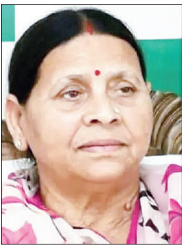
केंद्रीय रेल मंत्री थे। लालू प्रसाद ने पद पर रहते हुए नौकरी के बदले लोगों से जमीन लिखवाई। सीबीआई ने यह भी

नई दिल्ली, 29 मई (एजेंसियां)। नौकरी के बदले जमीन घोटाला मामले में दिल्ली की राज एवैन्स कोर्ट ने सीबीआई को 7 जून तक अंतिम चार्जशीट दाखिल करने का निर्देश दिया है। कोर्ट ने सीबीआई द्वारा हर तारीख पर चार्जशीट दाखिल करने के लिए समय मांगने पर भी नाराजगी जताई। इस मामले में लालू प्रसाद यादव और उनके परिवार के सदस्य आरोपी हैं।