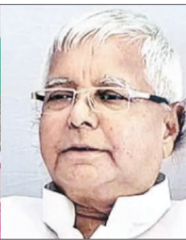
आरोप लगाया है कि रेलवे में की गई भर्तियां भारतीय रेलवे के मानकों के दिशा निर्देशों के अनुरूप नहीं थीं।

इस मामले में राऊज एवैन्स कोर्ट में सुनवाई होनी थी लेकिन सीबीआई ने चार्जशीट दाखिल करने का समय मांग लिया, जिससे सुनवाई टल गई। अब कोर्ट ने सीबीआई को आखिरी और सम्पूर्ण चार्जशीट दाखिल करने के लिए 7 जून तक का वक्त दिया है। चार्जशीट की प्रक्रिया आखिरी चरण में है, यह कहने पर कोर्ट ने सीबीआई को आड़े हाथों लिया और कहा कि हर बार सुनवाई के वक्त यही कहा जाता है। कोर्ट ने सख्त लहजे में सीबीआई को निर्देश दिया कि 7 जून तक चार्जशीट दाखिल कर दी जाए। इस मामले में ईडी लालू प्रसाद यादव के अलावा उनकी पत्नी राबड़ी देवी, बेटी मीसा भारती, तेजस्वी यादव आदि को भी पूछताछ के लिए बुला चुकी है।