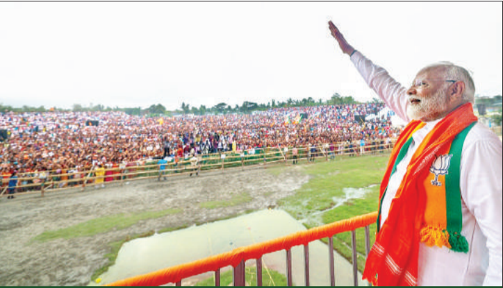
■ बंगाल को विपरीत दिशा में ले जा रहे टीएमसी और इंडी ■ भारत का सबसे बड़ा टर्निंग-प्वाइंट होगा चार जून 2024

पीएम मोदी ने रैली को संबोधित करते हुए कहा, मैं आज आपके साथ ही