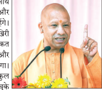
मुख्यमंत्री योगी आदित्यनाथ गोरखपुर से चुनावी दौरे पर निकलेंगे। वे पहली जनसभा हिमाचल प्रदेश की मंडी सीट पर करेंगे। यहां से भारतीय जनता पार्टी ने फिल्म अभिनेत्री कंगना रनौत को मैदान में उतारा है। योगी आदित्यनाथ जनसभा कर उनके लिए वोट मांगेंगे। इसके बाद योगी आदित्यनाथ केंद्रीय मंत्री व हमीरपुर के सांसद अनुराग सिंह ठाकुर के पक्ष में जनसभा करेंगे। हिमाचल प्रदेश के बाद योगी आदित्यनाथ पंजाब आएंगे। यहां की आनंदपुर साहिब लोकसभा सीट के लिए जनसभा करेंगे। यहां से भाजपा उम्मीदवार डॉ. सुभाष शर्मा के लिए वोट की अपील करेंगे। सातवें चरण की आखिरी जनसभा योगी आदित्यनाथ लुधियाना लोकसभा सीट के लिए करेंगे। यहां से भारतीय जनता पार्टी ने इस बार रवनीत सिंह बिट्टू को कमल निशान पर चुनाव में उतारा है।

लखनऊ, 29 मई (एजेंसियां)। उत्तर प्रदेश के मुख्यमंत्री व भारतीय जनता पार्टी के स्टार प्रचारक योगी आदित्यनाथ गुरुवार को हिमाचल प्रदेश और पंजाब के चुनावी दौरे पर रहेंगे। सातवें चरण के प्रचार के आखिरी दिन वे चार रैलियों में शिरकत करेंगे। पहली जून को सातवें और अंतिम चरण का मतदान होगा। योगी आदित्यनाथ अब तक कुल 12 राज्यों में चुनाव प्रचार कर चुके हैं। हिमाचल प्रदेश में प्रचार कर कुल 13 राज्यों में वे कमल खिलाने की अपील करेंगे।