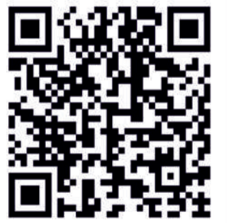
SCAN FOR SITE LOCATION

Everyone love to live in a beautiful & luxurious home where elders are happy & children grow up in a healthy environment. To experience the comfort of a spacious flat in a good neighbourhood, where fresh air & abundant water & the blissful silence of environment invites your family to live in comfort. Pushpa Residency is a prestigious project by Basai Group who have executed several successful projects. Their strength in the construction field can be gauged by the quality and dedication they bring to every project. we work hard to ensure customer satisfaction ... So why to wait now we provide you the luxurious flat in Thumkunta, Shamirpet .