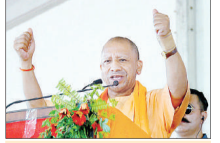
कांग्रेस और इंडी गठबंधन ने उड़ाया है संविधान का मखौल

सीएम योगी ने कांग्रेस और इंडी गठबंधन पर प्रहार करते हुए कहा कि संविधान का सबसे ज्यादा मखौल कांग्रेस पार्टी और इंडी गठबंधन से जुड़े लोगों ने उड़ाया है और आज भी वह यही कर रहे हैं। देश के अंदर स्वतंत्र भारत में संविधान बना ही था कि बाबा साहेब भीमराव अंबेडकर के विपरीत जाकर तत्कालीन कांग्रेस सरकार ने धारा 370 को देश के संविधान में जबरन डालने का काम किया था। कांग्रेस ने संविधान में कितने संशोधन किए यह किसी से छुपे नहीं हैं। कांग्रेस ने अपनी पहली ही सरकार में अभिव्यक्ति की स्वतंत्रता को कैंद