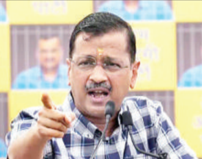
मोदी की नकल पर दे दी 10 गारंटी

नई दिल्ली, 12 मई (एजेंसियां)। घोटाले और भ्रष्टाचार में गिरफ्तार दिल्ली के मुख्यमंत्री अरविंद केजरीवाल जमानत पर जेल से बाहर आते ही प्रधानमंत्री की तरह घोषणाएं करने लगे। उन्होंने कहा भी कि देश में मोदी की गारंटी की चर्चा है। इसीलिए केजरीवाल भी गारंटियां देने लगे।