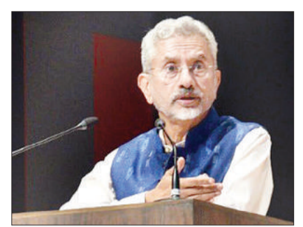
सीमा पर शांति के लिए संबंधों को परस्पर सामान्य करना जरूरी

विदेश मंत्री ने कहा कि शेष मुद्दे मुख्य रूप से गश्त करने के अधिकारों और गश्त क्षमताओं से संबंधित हैं। यह पूछे जाने पर कि प्रधानमंत्री नरेंद्र मोदी द्वारा पिछले महीने न्यूज-वीक पत्रिका में की गई टिप्पणी से उभरे विवाद के समाधान की उम्मीद कब की जा सकती है। इस पर जयशंकर ने कहा कि उन्होंने इस मामले में केवल बड़ी तस्वीर पेश की है। हम उम्मीद करेंगे कि वहां शेष मुद्दों का समाधान होगा। ये मुद्दे मुख्य रूप से वहां गश्त के अधिकार और गश्त क्षमताओं से संबंधित हैं। मैं इस मामले को प्रधानमंत्री के इंटरव्यू से नहीं जोड़ूंगा। मुझे लगता है कि प्रधानमंत्री बड़ी तस्वीर पेश कर रहे हैं और उनका बड़ी तस्वीर वाला नजरिया बहुत तार्किक नजरिया है, जो यह है कि आखिरकार पड़ोसी होने के नाते हर देश अपने पड़ोसियों के साथ अच्छे रिश्ते चाहता है। जयशंकर ने स्पष्ट कहा, लेकिन आज चीन के साथ हमारे संबंध सामान्य नहीं हैं क्योंकि सीमावर्ती क्षेत्रों में शांति भंग हो गई है। इसलिए प्रधानमंत्री उम्मीद कर रहे थे कि चीनी पक्ष को यह समझना चाहिए कि मौजूदा स्थिति उसके अपने हित में नहीं है। पीएम मोदी ने कहा था कि सीमा पर शांति लाने के लिए हालातों पर तुरंत बात करने की आवश्यकता है। भारत और चीन