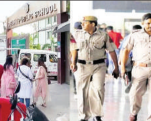
कर्णावती (गुजरात), 12 मई (एजेंसियां)। लोकसभा चुनाव में वोटिंग के एक दिन पहले अहमदाबाद के 36 स्कूलों को बम धमके से उड़ाने की धमकी देने वाला ई-मेल पाकिस्तान से आया था। इस बात का आधिकारिक

इस से लोग वोट डालने न निकलें, इसलिए भेजा गया था ई-मेल