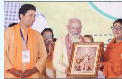
मां काली और भारत माता की पूजा करते हैं। रैली में जिन लोगों ने मेरी मां की तस्वीर बनाई है। मैं एसपीजी कमांडो से अपील करता हूँ कि वे तस्वीरें इकट्ठी कर लें। कृपया तस्वीर के पीछे अपना पता भी लिख दीजिएगा। मैं आप दोनों को धन्यवाद देना चाहता हूँ। ▶9

लागाया। राज्य की सत्तारूढ़ पार्टी टीएमसी पर आरोप लगाते हुए पीएम मोदी ने कहा, एक समय था, जब बंगाल में एक से बढ़कर एक वैज्ञानिक खोज हुआ करती थीं और आज टीएमसी के राज में जगह-जगह बम बनाने की होम इंडस्ट्री चल रही है। एक समय था, जब बंगाल घुसपैठियों के खिलाफ क्रांति किया करता था, लेकिन आज टीएमसी के संरक्षण में यहां घुसपैठी फल-फूल रहे हैं। ▶9