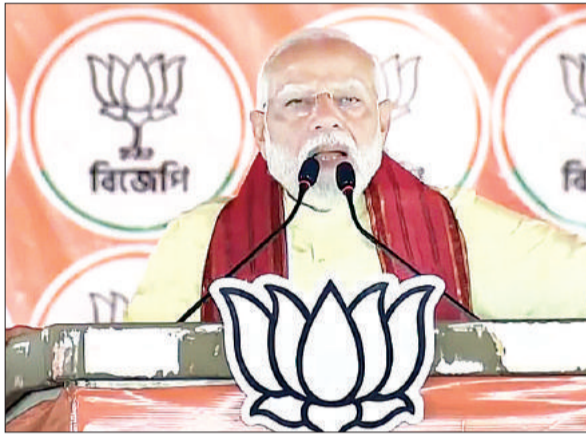
प्रधानमंत्री ने आरक्षण-सीए समेत बंगाल को दी पांच गारंटी