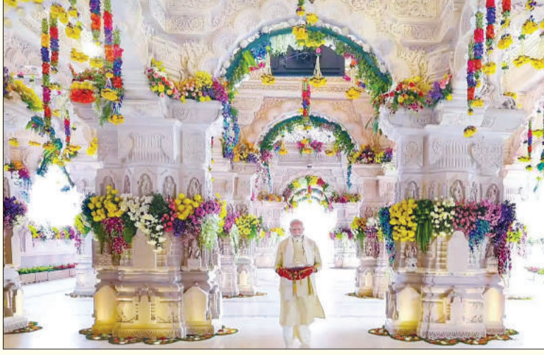
ताह अयोध्या, आह अयोध्या...

को समाजवादी पार्टी के उम्मीदवार अवधेश प्रसाद पासी ने हराया। इस साल की शुरुआत में जब राम मंदिर में रामलला की प्राण प्रतिष्ठा हुई, तो सारी दुनिया में संदेश गया कि हिंदुओं का 500 साल का संघर्ष रंग लाया और भगवान राम अपने जन्मस्थान पर बने भव्य मंदिर में आ गए। इन पांच सौ वर्षों के संघर्ष में 30 अक्टूबर 1990 को उत्तर प्रदेश के तत्कालीन मुख्यमंत्री एवं समाजवादी पार्टी के प्रमुख मुलायम सिंह यादव ने कारसेवकों पर गोलियां चलवाई थीं। पुलिस फायरिंग में पांच राम भक्त मारे गए थे। इस घटना के 3 दिन बाद ही 2 नवंबर को दूसरी बार पुलिस की बंदूकें गरजी थीं और डेढ़ दर्जन कारसेवकों को मौत के घाट उतार दिया गया था। मुलायम की गोली से शहीद होने वाले कारसेवकों में कोठारी बंधु भी शामिल थे। इसके करीब 2 साल बाद बाबरी का विध्वंस हुआ