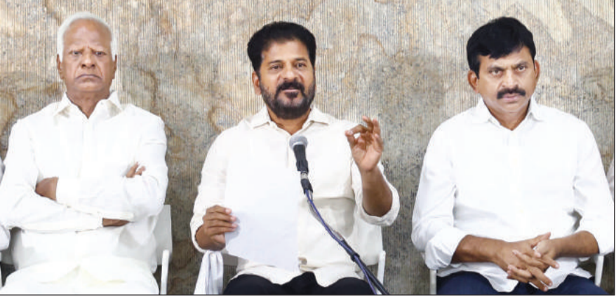
संकेत देता है। उन्होंने कहा कि जनता ने कांग्रेस के 100 दिनों के शासन का समर्थन किया है। (बीआरएस) नेताओं पर उन्होंने भारत राष्ट्र समिति भारतीय जनता पार्टी (भाजपा)

हैदराबाद, 05 जून (शुभ लाभ ब्यूरो)। तेलंगाना के मुख्यमंत्री रेवंत रेड्डी ने राज्य के लोगों को उनके समर्थन के लिए धन्यवाद दिया और कहा कि लोगों ने कांग्रेस के 100 दिन के शासन को पसंद किया है।