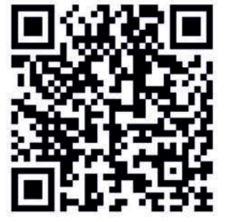
SCAN FOR SITE LOCATION

Everyone love to live in a beautiful & luxurious home where elders are happy & children grow up in a healthy environment. To experience the comfort of a spacious flat in a good neighbourhood, where fresh air & abundant water & the blissful silence of environment invites your family to live in comfort. Pushpa Residency is a prestigious project by Basai Group who have executed several successful projects. Their strength in the construction field can be gauged by the quality and dedication they bring to every project. we work hard to ensure customer satisfaction ... So why to wait now we provide you the luxurious flat in Thumkunta, Shamirpet .