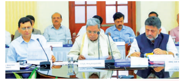
अगर अधिकारियों की लापरवाही से लोगों की जान गई तो इसे बर्दाश्त नहीं किया ... @ नममा बेंगलूरु

Postal Regd.No. HQ/SD/523/2023-25 | बुधवार, 10 जुलाई, 2024 | हैदराबाद और नई दिल्ली से प्रकाशित | epaper.shubhlabdaily.com | संपादक : गोपाल अग्रवाल | पृष्ठ : 14 | * | मूल्य-6 रु. | वर्ष-6 | अंक-191