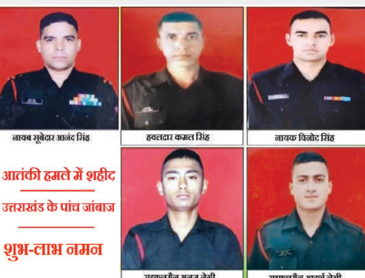
आतंकी हमले में शहीद उत्तराखंड के पांच जांबाज शुभ-लाभ नमन

सीएम धामी समेत कई नेताओं, अफसरों और नागरिकों ने दी श्रद्धांजलि