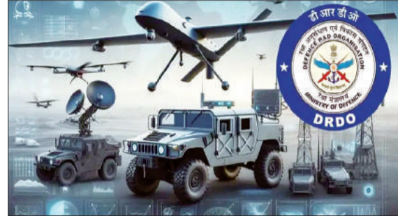
संवेदनशील रक्षा परियोजनाएं प्राइवेट संस्थाओं को देने पर सवाल फिर रक्षा विशेषज्ञों पर ही क्यों लगते हैं जासूसी के गंभीर आरोप

नई दिल्ली, 12 जुलाई (एजेंसियां)। केंद्र सरकार डीआरडीओ के कंधे पर हथियार रख कर निशाना साध रही है। रक्षा क्षेत्र की संवेदनशीलता का ध्यान रखे बगैर तमाम महत्वपूर्ण और जोखिम वाले प्रोजेक्ट्स धड़ाधड़ निजी संस्थानों को दिए जा रहे हैं। जब निजी संस्थाएं संवेदनशील रक्षा उत्पादन के क्षेत्र में घुस रही हैं तो फिर रक्षा विशेषज्ञों पर जासूसी के आरोप क्यों लगते हैं? संवेदनशील परियोजनाओं की सूचना लीक करने के जुर्म में रक्षा अधिकारियों को जेल में क्यों सड़ाया जाता है? इन सवालों का जवाब दिए बगैर निजी पूंजी प्रतिष्ठानों को उपकृत किए जाने का सिलसिला जारी है। तत्कालीन रक्षा मंत्री अरुण जेटली के कार्यकाल से शुरू हुआ यह गोरखधंधा राजनाथ सिंह के कार्यकाल तक जारी है। अब तो यह और भी तेज हो गया है। आत्मनिर्भरता के बहाने को बढ़ावा देते हुए केंद्र सरकार ने रक्षा अनुसंधान एवं विकास संगठन (डीआरडीओ) के जरिए सशस्त्र बलों, एयरोस्पेस और रक्षा क्षेत्र की जरूरतों को देखते हुए सात नई संवेदनशील परियोजनाएं मंजूरी की हैं। प्रौद्योगिकी विकास निधि योजना के तहत स्वीकृत इन परियोजनाओं का मकसद रक्षा और एयरोस्पेस क्षेत्रों में विशेष रूप से एमएसएमई और स्टार्टअप