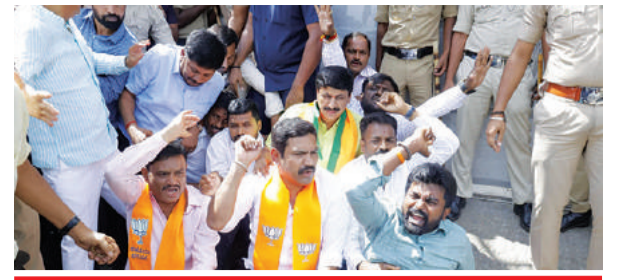
विरोध प्रदर्शन के लिए मैसूरु जा रहे भाजपा नेताओं को कनिमिनिके में रोका गया @ नम्मा बेंगलूरु

Postal Regd.No. HQ/SD/523/2023-25 | शनिवार, 13 जुलाई, 2024 | हैदराबाद और नई दिल्ली से प्रकाशित | epaper.shubhlabdaily.com | संपादक : गोपाल अग्रवाल | पृष्ठ : 14 | * | मूल्य-6 रु. | वर्ष-6 | अंक-194