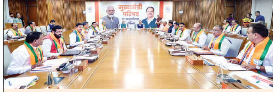
दो दिवसीय बैठक में 13 मुख्यमंत्री और 15 उप मुख्यमंत्री शामिल पीएम मोदी ने राज्यों से भविष्य की योजनाओं का लेखाजोखा लिया

नई दिल्ली, 28 जुलाई (एजेंसियां)। प्रधानमंत्री नरेंद्र मोदी सहित भारतीय जनता पार्टी के शीर्ष नेताओं ने शासन के मुद्दों पर लगातार दूसरे दिन रविवार को भी भाजपा शासित राज्यों के मुख्यमंत्रियों और उप मुख्यमंत्रियों के साथ मैराथन बैठक की। लोकसभा चुनाव में भाजपा का