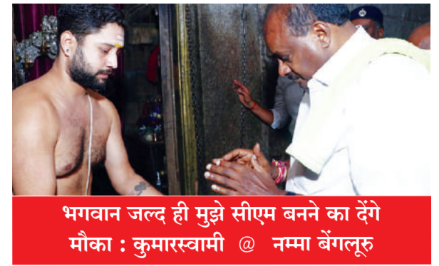
भगवान जल्द ही मुझे सीएम बनने का दैवं मौका : कुमारस्वामी @ नम्मा बेंगलूरु