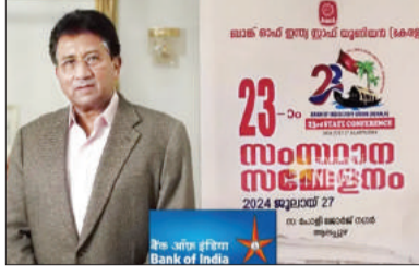
उद्घाटन किया। भारत को बाहरी दुश्मनों से जितना खतरा है, उससे कहीं ज्यादा देश के अंतर के दुश्मनों से खतरा है। देश के दुश्मनों को अपना हीरो

भारत सरकार की वित्तीय संस्था बैंक ऑफ इंडिया ने करगिल विजय दिवस के अगले ही दिन केरल के अलपुझा में करगिल युद्ध के खलनायक पाकिस्तान के तत्कालीन तानाशाह जनरल परवेज मुशरफ को श्रद्धांजलि देने का कार्यक्रम आयोजित किया। बैंक ऑफ इंडिया के कांग्रेस परस्त अधिकारियों-कर्मचारियों ने कांग्रेस के संरक्षण में यह कार्यक्रम आयोजित किया। इस कार्यक्रम में कांग्रेस के वरिष्ठ नेता एवं सांसद केसी वेणुगोपाल समेत कई स्थानीय कांग्रेस नेता मौजूद थे। वेणुगोपाल ने ही इस कार्यक्रम का