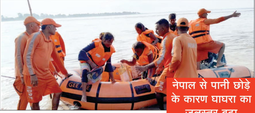
लखनऊ/बहराइच, 20 जुलाई (एजेंसियां)।

योगी सरकार प्रदेश के बाद प्रभावित इलाकों की लगातार मॉनिटरिंग कर रही है। यहाँ प्रशासन की ओर से आपदा प्रभावितों की हर संभव मदद की जा रही है। इसी क्रम में शुक्रवार शाम बहराइच में अचानक नेपाल से छोड़े गए पानी से खेत में काम कर रहे 194 लोग फंस गये। घटना की जानकारी मिलते ही प्रशासन ने रात में ही रेस्क्यू ऑपरेशन चलाकर 12 घंटे की कड़ी मशकत के बाद सभी को सुरक्षित स्थान पर पहुंचाया। रेस्क्यू टीम ने बाढ़ में फंसे 63