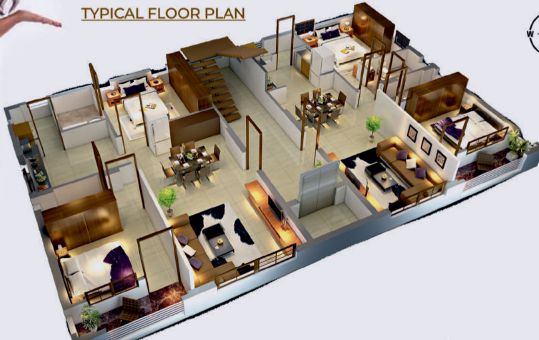
TYPICAL FLOOR PLAN

Ready to occupy @ Thumkunta << SHAMIRPET