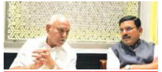
कोर्ट के आदेश का इंतजार किए बिना सीएम तुरंत इस्तीफा दें तो बेहतर होगा @ नम्मा बेंगलूर