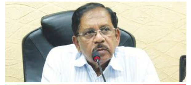
सरकार गिराने की रची जा रही साजिश : परमेश्वर @ नम्मा बेंगलूरु

Postal Regd.No. HQ/SD/523/2023-25 | सोमवार, 19 अगस्त, 2024 | हैदराबाद और नई दिल्ली से प्रकाशित | epaper.shubhlabdaily.com | संपादक : गोपाल अग्रवाल | पृष्ठ : 14 | * | मूल्य-6 रु. | वर्ष-6 | अंक-231