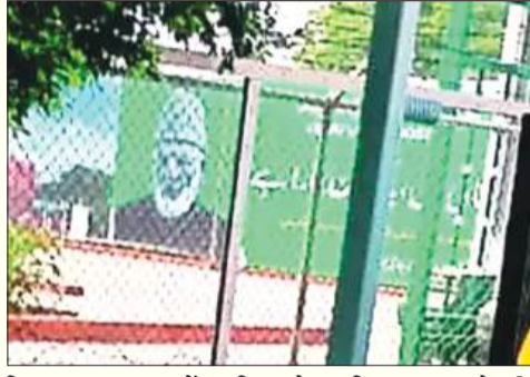
विधानसभा चुनाव में शामिल होकर भिरवघात करने की कोशिश कर रहे हैं।

अटारी, 29 अगस्त (एजेंसियां)। अमेरिका और वहां के कुछ पूंजीपति तत्व भारत के नस्लदूषित नेताओं के साथ मिल कर देश को अस्थिर करने में लगातार लगे हैं। इन तत्वों ने लोकसभा चुनाव में नरेंद्र मोदी को सत्ता से बेदखल करने की सारी कोशिशें की, लेकिन नाकाम रहे। इसके बाद अब वे जम्मू कश्मीर में होने जा रहे विधानसभा चुनाव को बाधित कर वहां पुरानी स्थितियां वापस लाने का षडयंत्र रच रहे हैं। इसमें पाकिस्तान की तरफ से भी लगातार शैतानियां हो रही हैं। उधर से आतंकवाद को लगातार बढ़ावा दिया जा रहा है। अब पाकिस्तान जम्मू कश्मीर के विधानसभा चुनाव को प्रभावित करने के लिए अलगाववादी तत्वों को उकसा रहा है। पाकिस्तान ने वाघा बॉर्डर पर भारतीय सीमा की ओर रुख करते हुए गद्दार हुर्रियत कॉन्फ्रेंस के नेता सैयद अली शाह गिलानी का एक बड़ा पोस्टर टांगा दिया है। आप जानते ही हैं कि लोकतांत्रिक प्रक्रियाओं का आज तक विरोध करते रहे अलगाववादी और राष्ट्रविरोधी सब