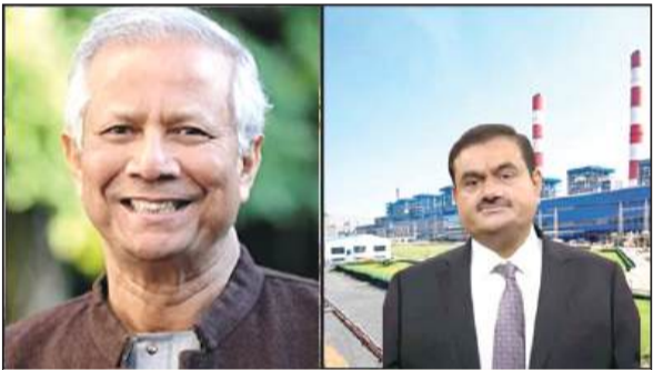
अडाणी पावर समेत 5 कंपनियों का 1.15 बिलियन डॉलर बकाया पुराने रिश्तों पर बांग्लादेश को उधार की बिजली दे रहा है भारत

नई दिल्ली, 29 अगस्त (एजेंसियां)। भारत बिजली काट दे तो बांग्लादेश घुप्प अंधेरे में खो जाएगा। वैसे भी प्रायोजित हिंसा और तख्तापलट के बाद से बांग्लादेश का भविष्य अंधेरे सुरंग की तरफ ही उन्मुख हो गया है। बांग्लादेश में जो बिजली जल रही है, वह भारत की तरफ से मिलती है, वह भी उधार में। भारत की बिजली कंपनियों का बांग्लादेश पर 9500 करोड़ से अधिक बकाया हो गया है। बांग्लादेश में हसीना सरकार के तख्तापलट के बाद यह पैसा लटक गया है। बांग्लादेश पर सबसे बड़ा बकाया अडाणी पावर का है। इतने बड़े बकायों के बावजूद भारतीय