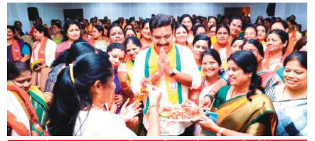
कांग्रेस सरकार महिला हिंसा के मामले में भी गैरजिम्मेदाराना तरीके से कर ... @ नम्मा बेंगलूर