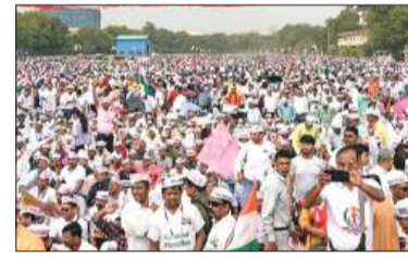
एनपीएस में कुछ बदलाव कर यूपीएस का जो ब्यौरा प्रस्तुत किया गया है, वह काफी अतार्किक और असंगत है। इसके चलते पूरे देश में एक बार फिर कर्मचारियों के मन में सरकार के प्रति नकारात्मक भाव पैदा हो गया है। देश के समस्त कर्मचारी जगत को उस वक्त यह विश्वास हुआ था, जब आपके द्वारा स्टाफ साइड की राष्ट्रीय परिषद (जेसीएम) को बातचीत के लिए बुलाया गया। कर्मचारियों को यह यकीन था कि सरकार, ओपीएस के संबंध में कोई ऐतिहासिक फैसला लेगी। जब वित्त सचिव (बाद में कैबिनेट सचिव नियुक्त) ने देश के सामने यूपीएस का मसौदा रखा तो