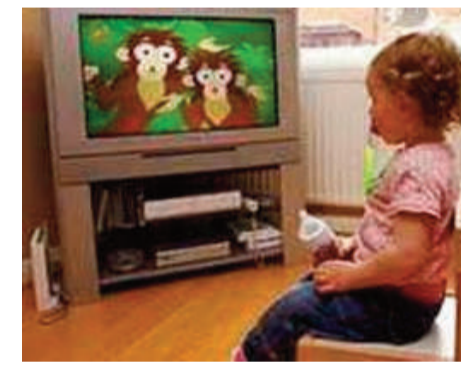
उदाहरण पेश करें। साथ ही बच्चों के लिए वक्त निकाल कर उनसे प्रेमपूर्ण बातें करनी चाहिए।