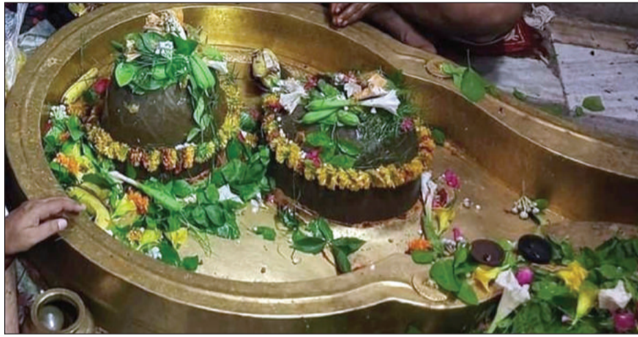
अलोपी शंकर महादेव मंदिर पर प्रतिदिन ही भक्तों का तांता लगा रहता है, लेकिन सावन मास में यहां

हजारों की संख्या में लोग अभिषेक करने पहुंचते हैं अलोपीशंकर की प्रसिद्धि दूरदराज तक है। सावन मास में जहां अलोपीशंकर के दर्शन करने जिलेभर के लोग पहुंचते हैं। वहीं अन्य प्रांतों से भी हजारों की संख्या में लोग अभिषेक करने पहुंचते हैं। कैलारस में 700 फीट ऊंची पहाड़ी पर अलोपीशंकर महादेव का मंदिर है। इसके लिए लोग 560 सीढियां चढ़कर दर्शन करने के लिए पहुंचते हैं।