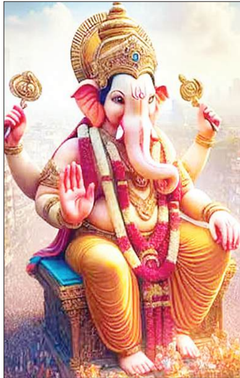
चंद्रोदय समय - रात 08.51

सुबह पूजा का समय - सुबह 06.06 - सुबह 07.42 पूजा मुहूर्त - शाम 05.17 - रात 09.41