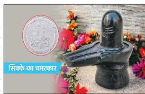
सिक्के का चमत्कार

भ गवान शिव के भक्त उनकी कृपा पाने के लिए शिवलिंग पर जल अर्पित करते हैं। लेकिन क्या आप जानते हैं कि शिवलिंग का एक उपाय आपको मालामाल बना सकता है। बस चंद पलों में आपके जीवन में सकारात्मक ऊर्जा का संचार कर सकता है और आपकी आर्थिक स्थिति भी मजबूत कर सकता है। धार्मिक विश्वास और ज्योतिष शास्त्र से जुड़ी ऐसी मान्यता है कि शिव जी धन के देवता कुबेर के गुरु हैं और चांदी को शुभ माना जाता है, इसलिए शिवलिंग पर चांदी का सिक्का चढ़ाने से धन प्राप्ति होती है। चांदी एक शुद्ध धातु मानी जाती है और ऐसा भी कहा जाता है कि ये भगवान शिव को प्रिय है। चांदी चमकदार और शीतल होती है, जो शिव जी के शांत स्वभाव का प्रतीक है। शिवलिंग पर चांदी चढ़ाने से धन