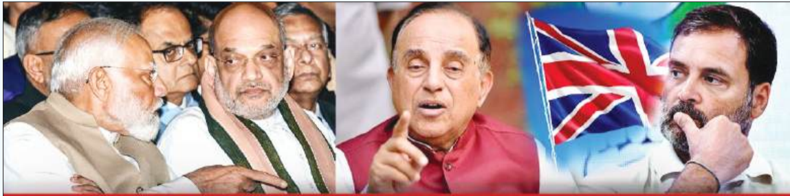
मोदी-शाह कर रहे राहुल की मदद, गृह मंत्रालय ने फाइल दबाई