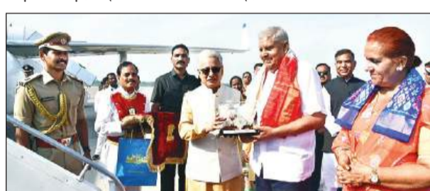
तेलंगाना के राज्यपाल जिष्णु देव वर्मा शनिवार को हैदराबाद के शमशाबाद हवाई अड्डे पर भारत के उपराष्ट्रपति जगदीप धनंधरा को गर्मजोशी से विदाई देते हुए।

बावजूद, उसके पेट में दर्द बना हुआ था, जिसके लिए अल्ट्रासाउंड और सीटी स्कैन की आवश्यकता पड़ी। इसमें एक फटे हुए डिम्बग्रंथि का पता चला जिसके कारण अत्यधिक आंतरिक रक्तस्राव हुआ। उन्होंने कहा कि हमें उसके पेट में चार लीटर खून मिला, जो फटी हुई डिम्बग्रंथि से रिस रहा था। कुछ डेंगू रोगियों को आंतरिक रक्तस्राव होता है। डेंगू रक्तस्राव सहित विभिन्न लक्षणों के साथ प्रकट होता है। जीवन-घातक स्थितियों से बचने के लिए समय पर इसकी पहचान करना और इसका इलाज करना बहुत महत्वपूर्ण है। स्त्री रोग विशेषज्ञ सलाहकार ने कहा इस मामले में हमने सफलतापूर्वक सर्जरी कर डिम्बग्रंथि को हटा दिया और आंतरिक रक्तस्राव को साफ कर दिया। सर्जरी से रक्तस्राव बंद हो गया और डेंगू नियंत्रण में होने के बाद, वह पूर्ण रूप से ठीक हो गई।