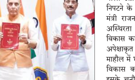
वैश्विक चुनौतियों के बीच शांति से आगे बढ़ रहा भारत

लखनऊ, 06 सितंबर (एजेंसियां)। भारतीय सेना के मध्य कमान मुख्यालय लखनऊ में हुए सैन्य कमांडरों के सम्मेलन में रक्षा मंत्री राजनाथ सिंह ने वैश्विक चुनौतियों का जिक्र करते हुए भारतीय सेना का आह्वान किया कि वह युद्ध के लिए तैयार रहे। राजनाथ ने कहा, भारत दुनिया का एकमात्र राष्ट्र है, जिसने वसुधैव कुटुम्बकम का संदेश दिया है और शांति की वकालत की है। भारत सदा से शांति का पुजारी था, है और रहेगा। लेकिन आज जैसी वैश्विक परिस्थितियाँ हैं उसमें सेना को युद्ध के लिए तैयार रहना होगा। इसका उद्देश्य यह है कि किसी भी सूरत में हमारी शांति भंग न होने पाए। रक्षा मंत्री राजनाथ सिंह गुरुवार को लखनऊ में सेना के कमांडरों के सम्मेलन को संबोधित कर रहे थे। इस मौके पर उन्होंने रूस-यूक्रेन युद्ध और इजरायल हमास युद्ध का जिक्र करते हुए कहा कि सेना के अधिकारी इन घटनाओं का विश्लेषण करें और भविष्य में देश के सामने आने वाली समस्याओं का अनुमान लगाने