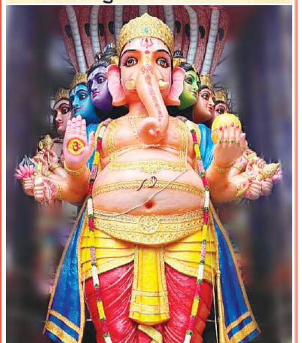
'शुभ-लाभ' के सुधी पाठकों, विज्ञापनदाताओं और हॉकरों को श्री गणेश चतुर्थी की हार्दिक शुभकामनाएं। विघ्नहर्ता आपके जीवन के प्रत्येक विघ्न हटें।

अवकाश सूचना भगवान गणेश जी की चतुर्थी के उपलक्ष्य में 'शुभ-लाभ' कार्यालय में शनिवार दि. 07 सितंबर, 2024 को अवकाश रहेगा। अतः 'शुभ-लाभ' का अगला अंक सोमवार 09 सितंबर, 2024 को प्रकाशित होगा। - प्रबंधक