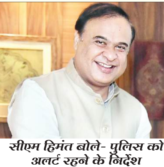
सीएम हिमंत बोले- पुलिस को अलर्ट रहने के निर्देश