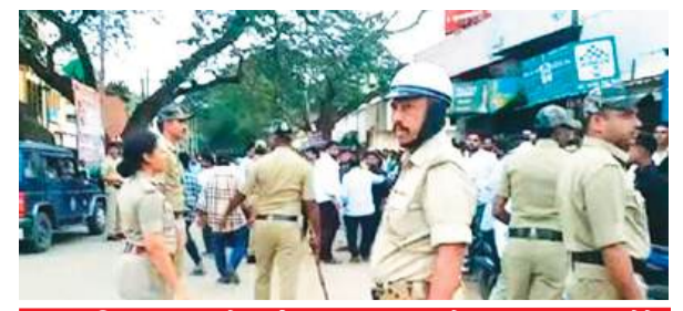
गणपति जुलूस के दौरान पथराव के बाद दावणगेरे में तनाव की स्थिति