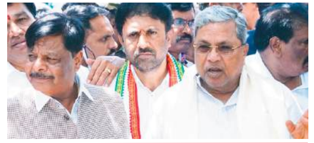
प्रधानमंत्री मोदी भाजपा के भीतर व्याप्त भ्रष्टाचार को करें दूर: सीएम @ नम्मा बेंगलूर