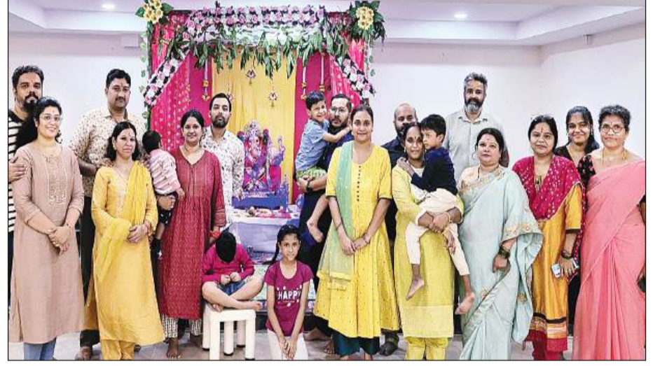
वीवीआर ग्रीन मीडोज, अपरपल्ली अतापुर द्वारा स्थापित गणेश प्रतिमा के आयोजन में पूजा-अर्चना करते हुए उपस्थित भगतगण।