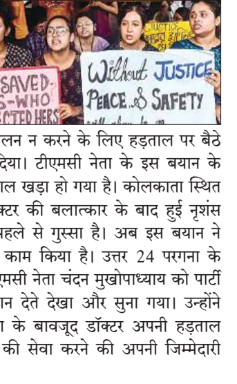
She saved lives who protected hers