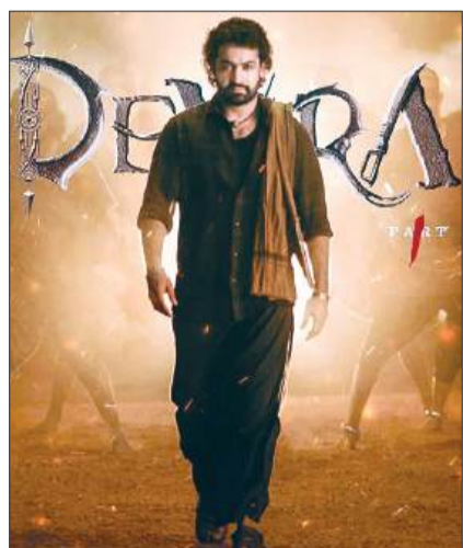
साधारण और डरपोक नजर आ रहे हैं। ट्रेलर बताता है कि देवरा (जूनियर एनटीआर) और सैफ

साथ सुपरस्टार जूनियर एनटीआर स्टार मास एक्शन ड्रामा फिल्म देवरा पार्ट 1 के ट्रेलर का इंतजार खत्म हो चुका है। देवरा पार्ट 1 का ट्रेलर अपने तय समय और डेट पर रिलीज हो गया है। देवरा पार्ट 1 के ट्रेलर का इंतजार जूनियर एनटीआर के फैंस को बेसब्री से था, जो आज खत्म हो गया है। देवरा पार्ट 1 के पहले टीजर और पोस्टर ने फैंस में फिल्म के प्रति बढ़ाई थी, लेकिन ट्रेलर देखने के बाद फैंस को 27 सितंबर तक का इंतजार भारी पड़ सकता है। देवरा पार्ट 1 एक मास ड्रामा एक्शन फिल्म है। इसमें जूनियर एनटीआर का डबल रोल में हैं। ट्रेलर में भी जूनियर एनटीआर के दो अवतार दिख रहे हैं। पहले अवतार में वह बाप के रोल में निडर, बहादुर और हिम्मतवाले नजर आ रहे हैं, जो अपने समंदर में सैफ अली खान से जंग लड़ते दिख रहे हैं। वहीं, दूसरे अवतार में वह एक आम इंसान की तरह