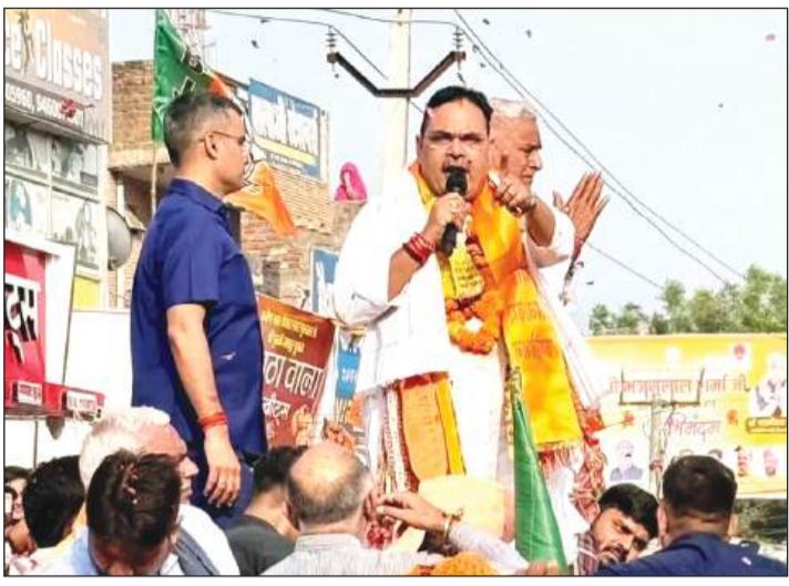
के विभिन्न सामाजिक संगठनों, व्यापार संगठनों एवं मुस्लिम समुदाय के लोगों ने जगह-जगह पर मुख्यमंत्री का अभिनंदन किया।