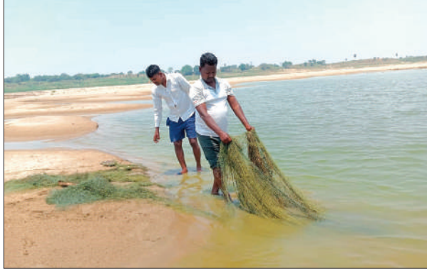
प्रयागराज, 17 नवंबर (एजेंसियां)

प्रयागराज में गंगा और यमुना का संगम सिर्फ दो नदियों का नहीं बल्कि सनातन धर्म को मानने वाले करोड़ों लोगों की आस्था का भी संगम है। हर साल देश और विदेश से आने वाले लाखों करोड़ों लोग यहां के स्वच्छ और निर्मल जल में आस्था की डुबकी लगाकर सनातन परंपरा का निर्वहन करते हैं। तीर्थों के तीर्थ संगम के प्रति लोगों की यह आस्था यूं ही बनी रहे, इसके लिए 500 गंगा प्रहरी दिन रात दोनों नदियों की स्वच्छता और निर्मलता को बनाए रखने में जुटे हुए हैं। महाकुंभ 2025 के दौरान जब करोड़ों लोग संगम में पवित्र स्नान करेंगे तब भी यही गंगा प्रहरी नदियों की स्वच्छता सुनिश्चित करने के लिए पहरेदार बनकर खड़े रहेंगे। योगी सरकार इन्हें ट्रेनिंग के साथ ही रोजगार से जोड़कर प्रोत्साहित कर रही है। प्रयागराज में छोटे बड़े करीब 25 घाट हैं। महाकुंभ के दौरान इन सभी घाटों पर आस्था का जनसैलाब उमड़ने वाला है। ऐसे में घाटों के साथ साथ गंगा और