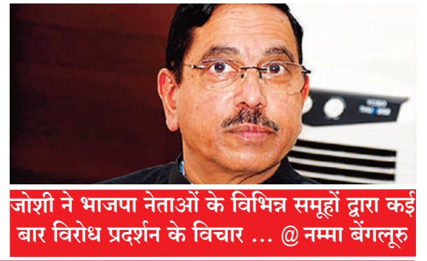
जोशी ने भाजपा नेताओं के विभिन्न समूहों द्वारा कई बार विरोध प्रदर्शन के विचार ... @ नम्मा बेंगलूरु

Postal Regd.No. HQ/SD/523/2023-25 | सोमवार, 18 नवंबर, 2024 | हैदराबाद और नई दिल्ली से प्रकाशित | epaper.shubhlabdaily.com | संपादक : गोपाल अग्रवाल | पृष्ठ : 14 | * | मूल्य-6 रु. | वर्ष-6 | अंक-318