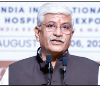
कई वर्षों से हम सब मिलकर प्रयास कर रहे थे। प्रधानमंत्री के आशीर्वाद से और सड़क परिवहन मंत्री नितिन गडकरी ने जो वादा जोधपुर के लोगों से किया था, मेरे अनुरोध को स्वीकार करते हुए अब वो प्रयासों और अवरोधों को पारकर हम सबको करनी चाहिए। जोधपुर एलिवेटेड रोड को लेकर उन्होंने कहा कि हम टेंडर की प्रक्रिया को पूरी कर इसका काम शुरू कर पाएंगे। उन्होंने बताया कि एलिवेटेड रोड की 968 करोड़ रुपये की लागत आयेगी। यह पहला चरण होगा और दूसरे चरण में आने वाले समय में इसे चौपामनी तक ले जाने का काम किया जायेगा। उन्होंने कहा कि अब हवाई अड्डे की टर्मिनल बिल्डिंग दिखाई देने लगी है। आने वाले तीन-चार महीने में यह बिल्डिंग पूरी हो जाएगी। इसे पूरा होने पर जोधपुर में आवागमन को लेकर बहुत बड़ा लाभ होगा। साथ ही रेलवे स्टेशन पुनर्विकास का काम शुरू हो चुका है। 500 करोड़ रुपये की लागत से जोधपुर रेलवे स्टेशन का नवीनीकरण एयरपोर्ट की तर्ज पर हो रहा है। श्री शेखावत ने कहा राजस्थान में डबल इंजन की सरकार है। हम जोधपुर लोकसभा क्षेत्र

जोधपुर, 17 नवंबर (एजेंसिया)। केंद्रीय संस्कृति एवं पर्यटन मंत्री गजेंद्र सिंह शेखावत ने कश्मीर में अनुच्छेद 370 को लेकर विपक्ष पर तीखा हमला बोलते हुए कहा है कि अब अनुच्छेद 370 को वापस लागू करने की कोई संभावना नहीं है। श्री शेखावत रविवार को जोधपुर पहुंचने पर हवाई अड्डे पर मीडिया से यह बात कही। उन्होंने दो टुक कहा कि अनुच्छेद 370 इस देश में अलगाव का बीज था, जड़ थी, देश के अस्तक पर एक काले टीके के समान था, जिसको प्रधानमंत्री नरेंद्र मोदी और केंद्रीय गृह मंत्री अमित शाह के सक्षम नेतृत्व ने जर्मीदोज करते हुए दफन कर दिया। उन्होंने कहा कि जैसा गृह मंत्री ने चुनाव की रैली को संबोधित करते हुए कहा, स्वयं इंदिरा गांधी स्वर्ग से लौटकर वापस यदि आ जाएं तो भी 370 वापस देश में लागू नहीं होगा।