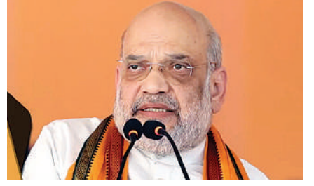
मणिपुर के हालात की अमित शाह ने की समीक्षा

भाजपा के वरिष्ठ नेता तथा केंद्रीय गृहमंत्री अमित शाह की विदर्भ के वर्धा, सावनेर, काटोल और गढ़चिरोली में रविवार को कुल चार चुनावी सभाएं होने वाली थीं। इन सभाओं के लिए अमित शाह 16 नवंबर की शाम को नागपुर पहुंचे। होटल रेडिसन ब्लू में उन्होंने अहम पदाधिकारियों और भाजपा के बड़े नेताओं से चर्चा की। इसके बाद