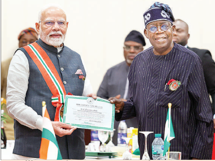
ग्रेंड कमांडर ऑफ द ऑर्डर ऑफ द नाइजर से सम्मानित

प्रधानमंत्री नरेंद्र मोदी 17 साल के अंतराल के बाद भारतीय प्रधानमंत्री के बतौर नाइजीरिया यात्रा पर रविवार को सुबह अबुजा पहुंचे। पीएम मोदी का भव्य स्वागत किया गया और उन्हें सम्मान स्वरूप अबुजा शहर की चाबी भेंट की गई। नाइजीरिया के राष्ट्रपति बोला अहमद टीनुबू ने अबुजा एयरपोर्ट पर पीएम मोदी का गर्मजोशी से स्वागत किया। नाइजीरिया