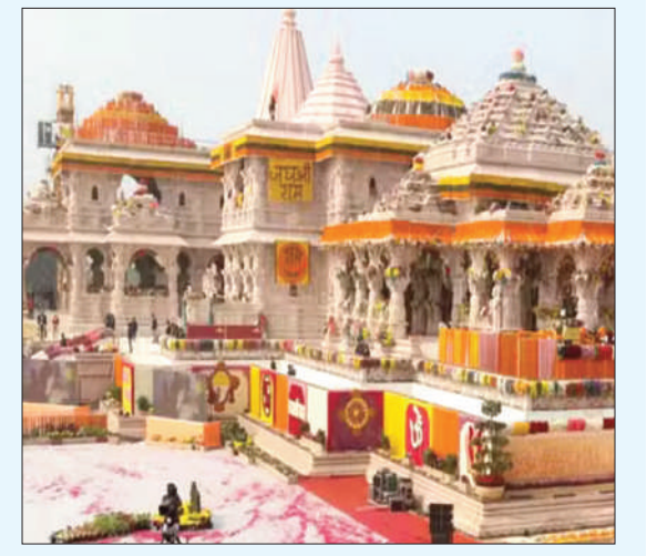
अयोध्या, 17 नवंबर (एजेंसियां)

अयोध्या में दीपावली और छठ पर्व के दौरान छुट्टी पर गए मजदूरों के लौटने के बाद राम मंदिर निर्माण कार्य की गति तेज हो गई है। राम मंदिर के शिखर का काम दिन-रात चल रहा है। शिखर की आठवीं लेयर का काम पूरा हो चुका है। राम मंदिर का शिखर 161 फीट ऊंचा होगा, शिखर कुल 29 लेयर में तैयार होगा। राम मंदिर निर्माण में इस समय दो हजार से अधिक कारीगर जुटे हैं। शिखर निर्माण में अलग से 200 कुशल कारीगरों को लगाया गया है। वहीं राम मंदिर के प्रथम तल में चल रहे फ्लोरिंग का काम पूरा हो चुका है, अब केवल फिनिशिंग का काम बाकी है। प्रथम तल पर रामदरबार को आकार देने का काम भी पूरा हो चुका है। प्रथम तल पर अब कोई काम शेष नहीं रहा। प्रथम तल के सभी दरवाजों का भी निर्माण हो गया है। प्रथम तल पर 14 दरवाजों लगाए जाएंगे।