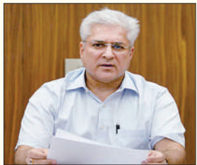
आपा की प्राथमिक सदस्यता भी छोड़ी