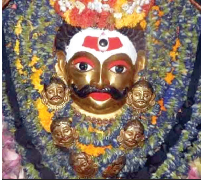
के कृष्ण पक्ष की अष्टमी तिथि 22 नवंबर को शाम छह बजकर सात मिनट पर शुरू होगी। इस तिथि का समापन 23 नवंबर को शाम सात बजकर 56 मिनट पर होगा। काल भैरव देव की पूजा निशा काल में होती है। इसलिए 22 नवंबर को कालाष्टमी मनाई जाएगी। इस

कालाष्टमी भैरव अष्टमी शुभ मुहूर्त वैदिक पंचांग के अनुसार, मार्गशीर्ष माह