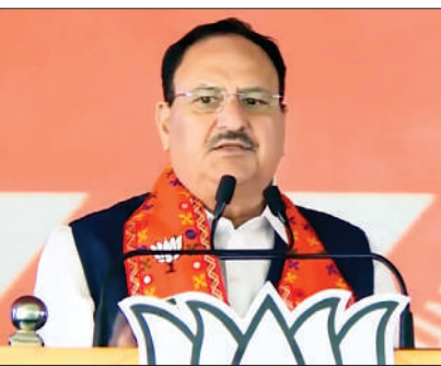
जेपी नड्डा ने दिया खुफिया एजेंसियों की रिपोर्ट का हवाला

भाजपा अध्यक्ष जेपी नड्डा ने रविवार को झारखंड में झारखंड मुक्ति मोर्चा के नेतृत्व वाली गठबंधन सरकार पर कई आरोप लगाए हैं। इस दौरान उन्होंने कांग्रेस नेता राहुल गांधी पर भी निशाना साधते हुए कहा कि वह ओबीसी के चैंपियन बना चाहते हैं, लेकिन उन्होंने सवाल किया कि राजीव गांधी फाउंडेशन और राष्ट्रीय सलाहकार समिति में कितने ओबीसी सदस्य हैं।