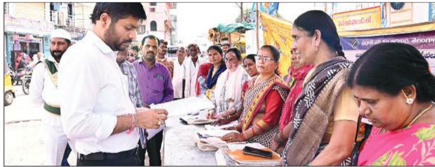
आसिफाबाद, 10 नवंबर (शुभ लाभ ब्यूरो)।