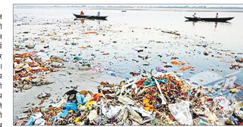
गंगा का जल महा प्रदूषित : आचमन लायक भी नहीं रहा गंगा की सफाई में नमामि गंगे की नाकामी पर चुप्पी सही