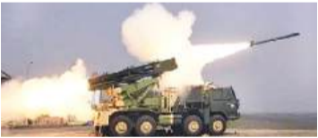
नई दिल्ली, 10 नवंबर (एजेंसियां)।

फ्रांस अपनी रक्षा जरूरतों को पूरी करने के लिए भारत निर्मित पिन्याक मल्टी-बैरल रॉकेट लॉन्चर सिस्टम खरीदने पर विचार कर रहा है। ऐसा कोई सौदा रक्षा क्षेत्र में मेक इन इंडिया पहल की एक बड़ी सफलता साबित होगा। पिन्याक मल्टी-बैरल रॉकेट लॉन्चर के मूल्यांकन के लिए एक शीर्ष फ्रांसीसी सैन्य अधिकारी अभी भारत आए हुए हैं।