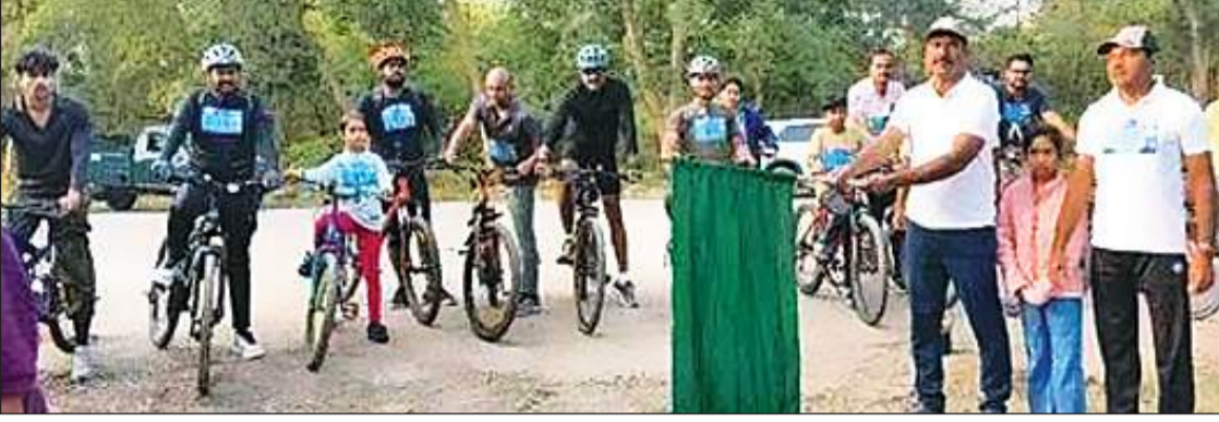
मंचेरियाल, 10 नवंबर (शुभ लाभ ब्यूरो)।

वन विभाग द्वारा पहली बार आयोजित साइक्लोथॉन को मंचेरियाल से मिली अच्छी प्रतिक्रिया