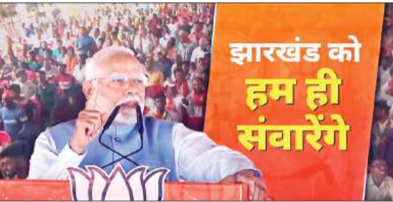
पीएम मोदी ने नारा बुलंद किया : एक हैं तो सेफ हैं भ्रष्टाचारियों को सरख्त सजा दिलाने की लड़ाई लड़ेंगे कांग्रेस-झामुमो की खतरनाक साजिश से सतर्क रहना होगा

रांची, 10 नवंबर (एजेंसियां)। झारखंड के औद्योगिक क्षेत्र बोकारो में आयोजित चुनावी रैली में प्रधानमंत्री नरेंद्र मोदी ने कहा कि कांग्रेस अनुसूचित जाति, अनुसूचित जनजाति और अन्य पिछड़ा वर्ग (ओबीसी) को तोड़कर उन्हें छोटी-छोटी जातियों में बांटना चाहती है। पीएम मोदी ने झारखंड की जनता को इससे आगाह रहने और एकजुट रहने को कहा और एक हैं तो सेफ हैं का नारा बुलंद किया।