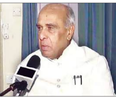
हद से बाहर जाकर सक्रियता दिखा रहे हैं कर्नाटक के मंत्री

जेपीसी अध्यक्ष जगदंबिका पाल ने कहा कि संसद सत्र के दौरान भी ऐसा कभी नहीं होता कि हर सत्र की बहस के दौरान सभी सांसद मौजूद