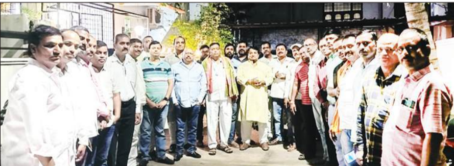
हैदराबाद, 10 नवंबर (शुभ लाभ ब्यूरो)।

बीजेयूप राजपूत सेवा संघ की मासिक बैठक सम्पन्न