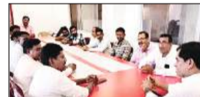
मंचेरियाल, 10 नवंबर (शुभ लाभ ब्यूरो)।

शिक्षकों की समस्याओं का तत्काल समाधान किया जाए : रघुनाथ