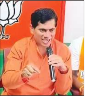
मंचेरियाल, 10 नवंबर (शुभ लाभ ब्यूरो)।