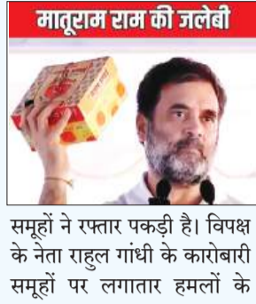
मातृम राम की जलेबी समूहों ने रफ्तार पकड़ी है। विपक्ष के नेता राहुल गांधी के कारोबारी समूहों पर लगातार हमलों के

की अर्थ व्यवस्था की स्थिति और उसमें छोटे से लेकर मझोले और बड़े कारोबारी प्रतिष्ठानों की भागीदारी को लेकर व्यापक शोध किया है। उस शोध ने साबित कर दिया कि कांग्रेस नेता राहुल गांधी का एकाधिकार बनाम सर्वाधिकार का डायलॉग पुरानी अप्रासंगिक वामपंथी किताब से निकाला गया पर्चा-