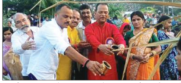
हैदराबाद, 10 नवंबर (शुभ लाभ ब्यूरो)।