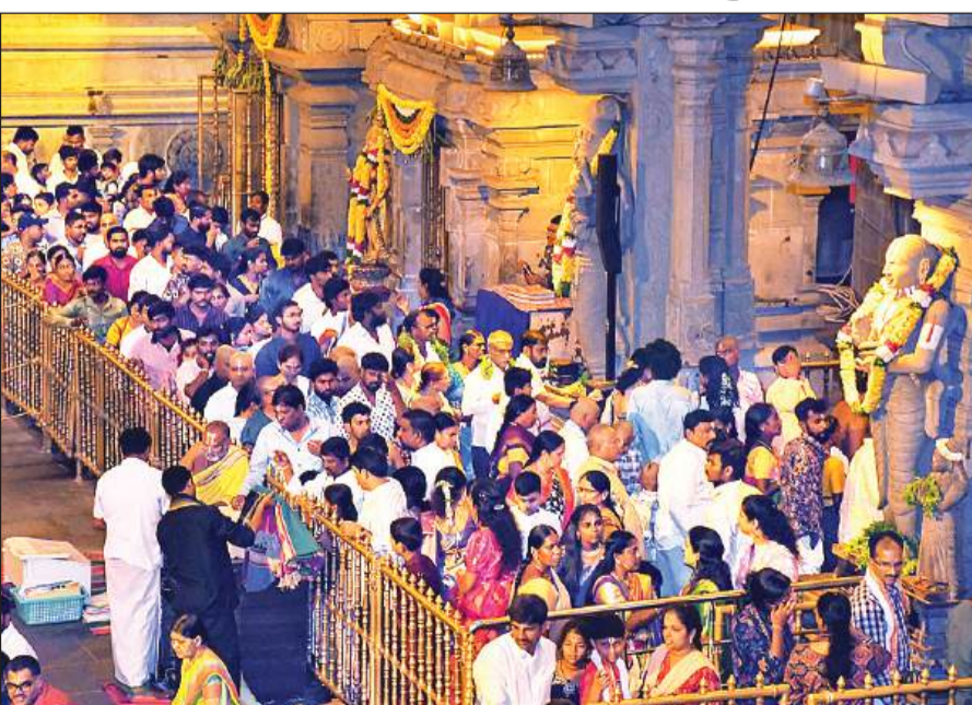
यादगिरिगुडा, 10 नवंबर (शुभ लाभ ब्यूरो)।

श्रीलक्ष्मी नरसिम्हा स्वामी के दर्शनों को उमड़ी श्रद्धालुओं की भीड़