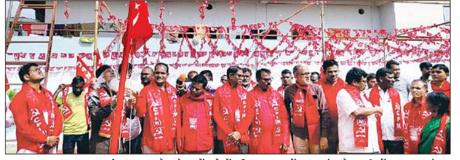
कागजनगर, 10 नवंबर (शुभ लाभ ब्यूरो)।

जनसमस्याओं पर व्यापक आन्दोलन किए जाएं। सीपीआई (एम) राज्य सचिव कॉमरेड पलादुगु भास्कर ने सीपीआई एम के तीसरे जिला सम्मेलन का उद्घाटन करते हुए यह बात कही। उन्होंने कहा कि आज भारत कई क्षेत्रों में कई उतार-चढ़ाव और कई चुनौतियों का सामना कर रहा