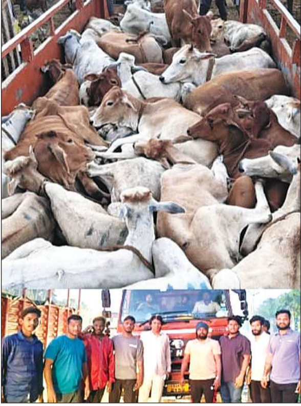
हैदराबाद में काटने के मकसद से अवैध रूप से गाड़ियों में भरकर लाए जा रहे गोवंश को गौरक्षा दल तेलंगाना, बजरंग दल, हिंदू तख्त एवं विश्व हिंदू परिषद के कार्यकर्ता गाय बचाओ के विशेष अभियान में किसी भी हद तक गायों को कटने से बचा रहे हैं। यहां सनातनी नववर्ष के दिन के बाद से गाय पकड़ने का सिलसिला जारी है। गौरक्षकों ने पहली डीसीएम गाड़ी में 62 गोवंश वनस्थलीपुरम पुलिस की सहायता से तथा दूसरी गाड़ी में मौजूद 23 गोवंश मेडचल पुलिस की सहायता से तथा तीसरी गाड़ी में मौजूद 07 गोवंश को घटकेसर पुलिस की सहायता से छुड़ाया गया।

इन वाहनों में भरी कुल 92 गायों को पुलिस की सहायता से कटने से बचाया गया। गाड़ियों में भरे अवैध गोवंश को हैदराबाद के कत्लखाने ले जाया जा रहा था। गोवंश को वहां की पुलिस