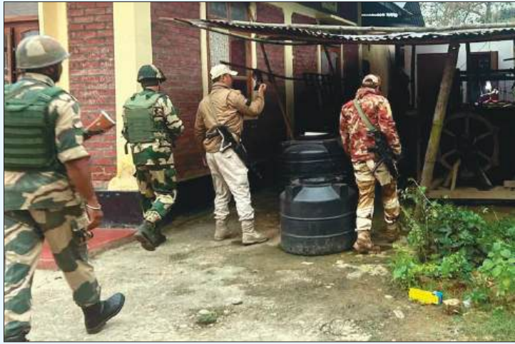
सीआरपीएफ कैम्प पर अंधाधुंध गोलीबारी कर दी थी। भीषण मुठभेड़ के बाद बल ने अत्याधुनिक हथियारों का एक बड़ा जखीरा भी जप्त किया। मणिपुर भेजी जाने वाली 20 नई केंद्रीय सशस्त्र पुलिस बल (सीएपीएफ) कंपनियों

सोमवार को केंद्रीय रिजर्व पुलिस बल (सीआरपीएफ) के साथ भीषण मुठभेड़ में कम से कम 10 संदिग्ध आतंकवादी मारे गए। यह मुठभेड़ तब हुई जब वदी पहने और अत्याधुनिक हथियारों से लैस उग्रवादियों ने जिरिबाम जिले के जाकुंधोर में बोरोबेका पुलिस स्टेशन और उससे सटे