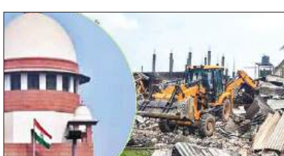
15 दिन पहले देना होगा नोटिस कार्टवाइ की वीडियोग्राफी होगी

नई दिल्ली, 13 नवंबर (एजेंसियां)। जमीयत उलेमा-ए-हिन्द बनाम उत्तरी दिल्ली नगर निगम से संबंधित मामले में बुलडोजर एक्शन पर रोक लगाने की मांग करने वाली याचिकाओं पर सुनवाई करते हुए शीफ कोर्ट ने कहा कि कानून का शासन यह सुनिश्चित करता है कि लोगों को यह पता हो कि उनकी सम्पत्ति को बिना किसी उचित कारण के नहीं छीना जा सकता। सुप्रीम कोर्ट ने बुलडोजर एक्शन के लिए सख्त दिशा निर्देश जारी किए हैं और संबंधित जिले के जिलाधिकारी को इस पर निगरानी रखने को कहा है।