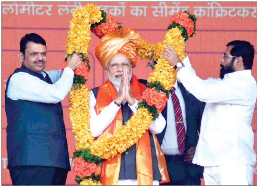
पर जवाब नहीं दिए। हम सदा जनता के बीच रहकर काम करते रहे। इससे लोगों को पता चल गया कि हम काम करने वाले लोग हैं और उन्हें जनता ने आईना दिखाया। लोगों ने विकास को महत्व दिया है। चुनाव में हम सबने मिलकर काम किया। प्रधानमंत्री नरेंद्र मोदी जी ने कहा

इस ऐतिहासिक जीत पर महाराष्ट्र के मुख्यमंत्री एकनाथ शिंदे ने कहा, हमने विपक्ष के आरोपों