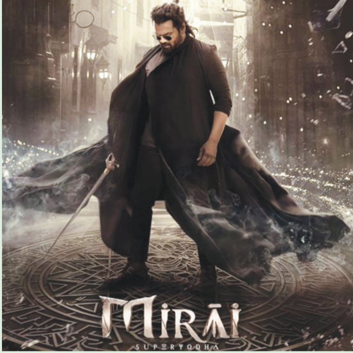
मीडिया पर एक पोस्ट साझा किया। इसमें उन्होंने लिखा, मैं इस पल का काफी लंबे समय से इंतजार कर रहा था ताकि मैं

इस फिल्म में उनका किरदार काफी खतरनाक होने वाला है। फिल्म के निर्माताओं ने उनके जन्मदिन पर अभिनेता की पहली झलक भी दिखाई है। निर्माताओं ने एक टीजर वीडियो जारी किया, जिसमें वह द ब्लैक स्वॉर्ड के किरदार में नजर आ रहे हैं। यह एक संगठन है, जो काफी खूंखार और खतरनाक है। लंबे और बंधे बालों के साथ एक योद्धा के अवतार में मनोज काफी जंच रहे हैं। अपने किरदार से फैंस को रूबरू कराते हुए अभिनेता ने सोशल