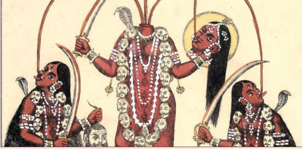
मां छिन्नमस्ता का महत्व