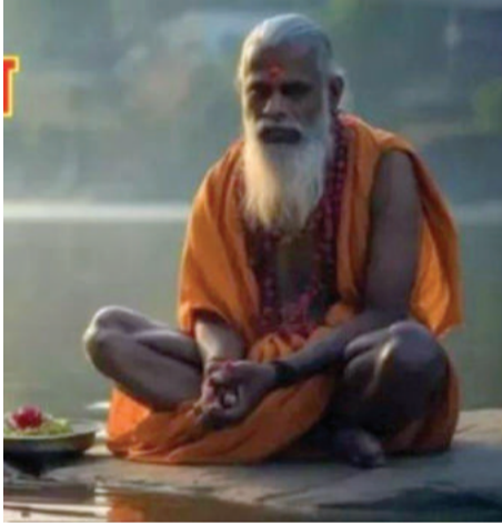
समय सूर्योदय का होता है।

23 जून से आषाढ़ मास शुरू हो गया है। यह महीना भगवान विष्णु को समर्पित माना जाता है। आषाढ़ माह में कई व्रत और त्योहार आते हैं। हिंदू कैलेंडर के अनुसार, आषाढ़ चौथा महीना है। पितरों को प्रसन्न करने के लिए भी आषाढ़ का महीना बहुत खास माना जाता है।