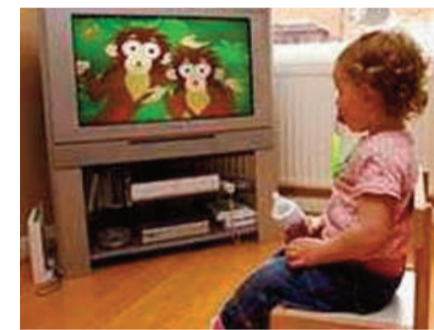
उदाहरण पेश करें। साथ ही बच्चों के लिए वक्त निकाल कर उनसे प्रेमपूर्ण बातें करनी चाहिए।