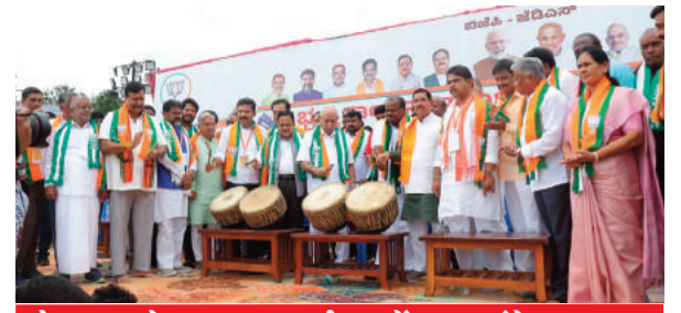
मैसूरु चलो पदयात्रा कर्नाटक में भ्रष्ट कांग्रेस सरकार को उखाड़ फेंकने की ताकत .... @ नम्मा बेंगलूरु