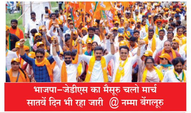
भाजपा-जेडीएस का मैसूर चलो मार्च सातवें दिन भी रहा जारी @ नम्मा बेंगलूरु

Postal Regd.No. HQ/SD/523/2023-25 | शनिवार, 10 अगस्त, 2024 | हैदराबाद और नई दिल्ली से प्रकाशित | epaper.shubhlabhdaily.com | संपादक : गोपाल अग्रवाल | पृष्ठ : 14 | मूल्य-6 रु. | वर्ष-6 | अंक-222