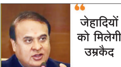
जेहादियों को मिलेगी उग्रकैद

गुवाहाटी, 05 अगस्त (एजेंसियां)। असम सरकार जमीन जेहाद और लव जेहाद के खिलाफ निर्णायक कार्रवाई कर रही है। लव जेहाद और लैंड जेहाद को रोकने के लिए हिमंत सरकार दो कानून ला रही है। मुख्यमंत्री हिमंत बिस्व सरमा ने बताया कि लैंड जेहाद और लव जेहाद पर