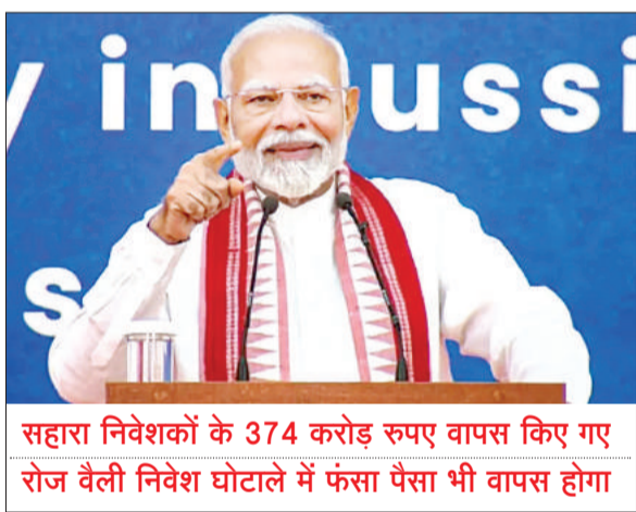
सहारा निवेशकों के 374 करोड़ रूपए वापस किए गए रोज वैली निवेश घोटाले में फंसा पैसा भी वापस होगा

नई दिल्ली, 05 अगस्त (एजेंसियां)। भारत सरकार ने रोज वैली और सहारा निवेश घोटाले के भुक्खड़ों को उनका पैसा लौटाने का काम शुरू कर दिया है। उल्लेखनीय है कि प्रधानमंत्री नरेंद्र मोदी ने लोकसभा चुनाव से पहले ऐलान किया था कि सरकार गरीबों से फर्जीबाड़े द्वारा लिया गया पैसा वापस करेगी। यह पैसा घोटालेबाजों की जब सम्पत्ति से लौटाया जाएगा। अब इस दिशा में काम चालू हो गया है। मोदी सरकार ने रोज वैली और सहारा घोटाला का पैसा पीड़ितों को लौटाना चालू कर दिया है। प्रधानमंत्री के वादे के अनुसार, प्रवर्तन निदेशालय (ईडी) पश्चिम