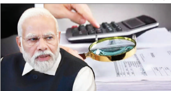
अवैध रूप से चीन भेजा जा रहा था भारत का पैसा 3 महीने में चीनी कंपनियों पर लग जाएगा ताला

नई दिल्ली, 05 अगस्त (एजेंसियां)। भारत से पैसों की उगाही कर चीन भेजने के मामले में सरकार सख्त कदम उठा रही है। भारत सरकार अगले 3 माह में सिस्टमेटिक तरीके से 400 चीनी कंपनियों पर ताला लगाने वाली है। इन कंपनियों पर भारत में अवैध तरीके से काम करने, मनी लॉन्ड्रिंग के आरोप हैं। ऐसी कंपनियों देश के 17 राज्यों में हैं, जो ऑनलाइन लोन, जॉब पोर्टल की शकल में काम कर रही हैं और भारतीय पैसों को अवैध तरीके से चीन भेज रही हैं। इन कंपनियों में डायरेक्टर तो भारतीय हैं, लेकिन पैसा चीनी कंपनियों के लगे हुए हैं।