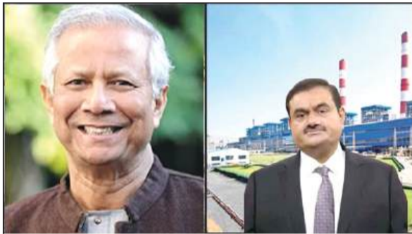
अडाणी पावर समेत 5 कंपनियों का 1.15 बिलियन डॉलर बकाया पुराने रिश्तों पर बांग्लादेश को उधार की बिजली दे रहा है भारत

नई दिल्ली, 29 अगस्त (एजेंसियां)। भारत बिजली काट दे तो बांग्लादेश घुप्प अंधेरे में खो जाएगा। वैसे भी प्रायोजित हिंसा और तख्तापलट के बाद से बांग्लादेश का भविष्य अंधेरे सुरंग की तरफ ही उन्मुख हो गया है। बांग्लादेश में जो बिजली जल रही है, वह भारत की तरफ से मिलती है, वह भी उधार में। भारत की बिजली कंपनियों का बांग्लादेश पर 9500 करोड़ से अधिक बकाया हो गया है। बांग्लादेश में हसीना सरकार के तख्तापलट के बाद यह पैसा लटक गया है। बांग्लादेश पर सबसे बड़ा बकाया अडाणी पावर का है। इतने बड़े बकायों के बावजूद भारतीय