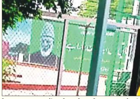
विधानसभा चुनाव में शामिल होकर भितरघात करने की कोशिश कर रहे हैं।

अटारी, 29 अगस्त (एजेंसियां)। अमेरिका और वहां के कुछ पूंजीपशु तत्व भारत के नस्लदूषित नेताओं के साथ मिल कर देश को अस्थिर करने में लगातार लगे हैं। इन तत्वों ने लोकसभा चुनाव में नरेंद्र मोदी को सत्ता से बेदखल करने की सारी कोशिशें की, लेकिन नाकाम रहे। इसके बाद अब वे जम्मू कश्मीर में होने जा रहे विधानसभा चुनाव को बाधित कर वहां पुरानी स्थितियां वापस लाने का षडयंत्र रच रहे हैं। इसमें पाकिस्तान की तरफ से भी लगातार शैतानियां हो रही हैं। उधर से आतंकवाद को लगातार बढ़ावा दिया जा रहा है। अब पाकिस्तान जम्मू कश्मीर के विधानसभा चुनाव को प्रभावित करने के लिए अलगाववादी तत्वों को उकसा रहा है।