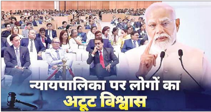
न्यायपालिका पर लोगों का अटूट विश्वास

प्रधानमंत्री नरेंद्र मोदी ने सुप्रीम कोर्ट के मुख्य न्यायाधीश और अन्य जजों की मौजूदगी में महिला अपराध से जुड़े मामलों को लेकर बड़ा आह्वान किया। पीएम मोदी ने कहा कि महिलाओं की सुरक्षा और उनके खिलाफ होने वाले अपराध के फैसलों में तेजी लाने की जरूरत है। प्रधानमंत्री मोदी ने बीते दिनों कलकत्ता में लेडी डॉक्टर के साथ हुए रेप और हत्याकांड के संदर्भ में न्यायाधीशों से यह बात कही, हालांकि उन्होंने इस बात पर गहरा संतोष जताया कि कलकत्ता की घटना पर सुप्रीम कोर्ट ने स्वतः संज्ञान लिया था। पीएम मोदी ने कहा कि आज