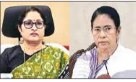
नई दिल्ली/कोलकाता, 31 अगस्त (एजेंसियां)।

कोलकाता रेप केस में ममता बनर्जी की चाल हुई बेचाळ