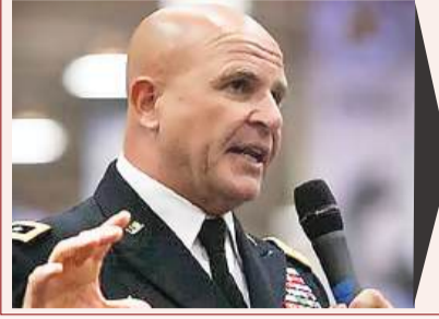
पाकिस्तान झूठ और धोखे के अलावा कुछ भी नहीं देता

विदेश मंत्रालय और पेंटागन से विरोध का सामना करना पड़ा था। अमेरिका के पूर्व राष्ट्रपति डोनाल्ड ट्रंप के प्रशासन के दौरान राष्ट्रीय सुरक्षा सलाहकार (एनएसए) के रूप में अपने कार्यकाल का विवरण देते हुए मैकमास्टर ने अपनी किताब एट वॉर विद आवरसेल्स में कई खुलासे किए हैं। उन्होंने बताया कि ट्रंप ने निर्देश दिया था कि जब तक पाकिस्तान आतंकवादियों को पनाह देना बंद नहीं कर देता, तब तक उसे दी जाने वाली सहायता रोक दी जाए। इसके बावजूद, तत्कालीन रक्षा मंत्री जिम