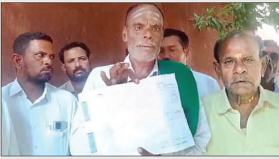
जमीन एवं हिंदू बस्तियों पर दावा ठोक रहा है। यह हरकतें वक्फ बोर्ड की बौखलाहट भी है और कानून में संशोधन की सरकारी प्रक्रिया में बाधा डालना भी है। अब वह दिन भी आने वाला है कि जब वक्फ बोर्ड पूरे

बंगलुरु, 28 अक्टूबर (एजेंसियां)। केंद्र सरकार द्वारा वक्फ कानून में संशोधन की पहल होते ही वक्फ बोर्ड ने पूरे देश में अराजकता फैलाना शुरू कर दिया है। किसी भी सम्पत्ति पर दावा ठोक देना और वक्फ बोर्ड की सम्पत्ति बता कर लोगों में दहशत फैलाना और गुंडई करना आम घटना हो गई है। वक्फ बोर्ड मंदिरों और हिंदुओं को नियोजित तरीके से निशाना बना रहा है और मंदिरों की