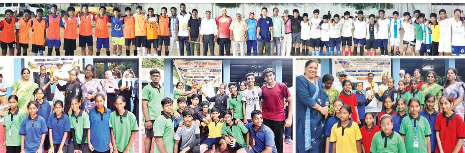
हैदराबाद, 19 अक्टूबर (शुभ लाभ ब्यूरो)।

अग्रवाल शिक्षा समिति द्वारा संचालित एलबीएमटी हाईस्कूल के छात्रों ने हैदराबाद डिस्ट्रिक्ट स्कूल गेम्स फेडरेशन द्वारा आयोजित खेल प्रतियोगिताओं में शानदार प्रदर्शन कर विजय पताका लहराई। प्रेस को जारी विज्ञप्ति के अनुसार जिला-स्तरीय पर गत 24 सितंबर को हैडबॉल प्रतियोगिता आयोजित की गई थी, जिसमें 17 वर्ष की आयु वर्ग श्रेणी में लगभग 32 स्कूलों के छात्रों ने भाग लिया। इसमें