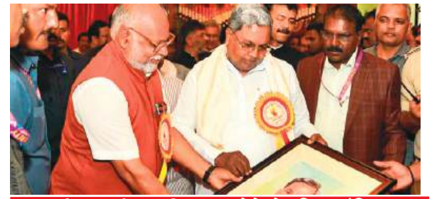
कर्नाटक को प्रगतिशील होने के लिए दंडित न करे केंद्र सरकार: सीएम @ नम्मा बेंगलूरु

Postal Regd.No. HQ/SD/523/2023-25 | शनिवार, 02 नवंबर, 2024 | हैदराबाद और नई दिल्ली से प्रकाशित | epaper.shubhlabdaily.com | संपादक : गोपाल अग्रवाल | पृष्ठ : 14 | * | मूल्य-6 रु. | वर्ष-6 | अंक-302