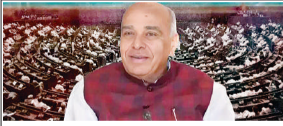
समिति का कार्यकाल बढ़ाया, विधेयक गया ठंडे बस्ते में समिति का कार्यकाल अगले बजट सत्र तक के लिए बढ़ा

वक्फ (संशोधन) विधेयक के विभिन्न पहलुओं पर विचार करने वाली संयुक्त संसदीय समिति (जेपीसी) का कार्यकाल अगले बजट सत्र तक बढ़ा दिया गया है। समिति की बैठक में विपक्षी सदस्यों के विरोध के बाद सर्वसम्मति से निर्णय लिया गया कि समिति अपनी रिपोर्ट को अंतिम रूप देने के लिए और समय मांगेगी। इसके बाद समिति के कार्यकाल को बजट सत्र के पहले हफ्ते तक के लिए बढ़ाने का प्रस्ताव दिया गया। वक्फ से जुड़े नए कानून को लेकर फिलहाल दो महीने तक