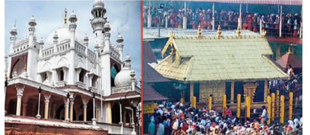
भगवान अयप्पा के दर्शन के लिए कराई जा रही है वाबर की पूजा

मार्ग में श्रद्धालुओं को शुद्ध भोजन तक नहीं मिलता है। पीने का पानी और शौचालय जैसी मूलभूत सुविधाएं भी नहीं हैं। बुजुर्ग श्रद्धालुओं के लिए रास्ते में विश्राम करने तक की सुविधा नहीं है। जबकि इस मंदिर और