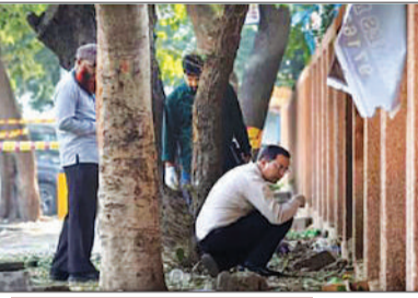
मौके पर मिला सफेद पाउडर, बैलिस्टिक जांच के लिए भेजा गया

देश की राजधानी दिल्ली में रोहिणी के प्रशांत विहार इलाके में एक स्कूटर में जोरदार धमाका हुआ। विस्फोट के बाद स्कूटर के आस-पास सफेद पाउडर की धूल बिखरी मिली है। आशंका है कि सफेद पाउडर कोई खतरनाक विस्फोटक है, उसके अंश फॉरेंसिक और बैलिस्टिक