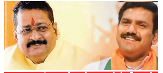
भाजपा गुट की लड़ाई पर रोक लगाने के लिए कोरु कमेटी की बैठक 3 दिसंबर को @ नम्मा बेंगलूरु