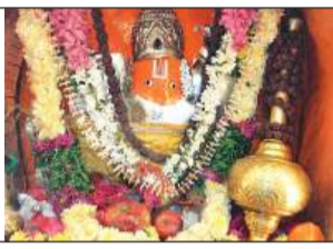
संगीतमय सुन्दर काण्ड एवं भजन