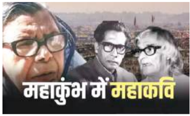
महाकुंभ में महाकवि