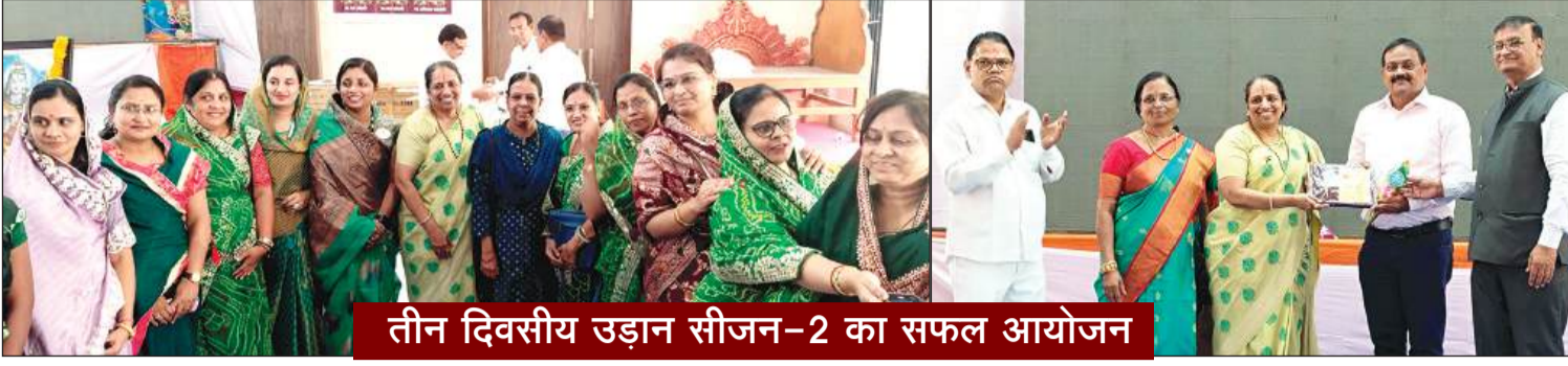
तीन दिवसीय उड़ान सीजन-2 का सफल आयोजन