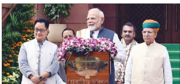
हमारे सांसद भी और हमारी संसद भी। मुट्टी भर लोगों की हुड़दंग बाजी से संसद में स्वस्थ चर्चा हो, ज्यादा से ज्यादा लोग चर्चा में अपना योगदान दें।

नई दिल्ली, 25 नवंबर (एजेंसियां)। संसद के शीतकालीन सत्र की शुरुआत में मीडिया से बात करते हुए प्रधानमंत्री नरेंद्र मोदी ने सभी सांसदों से संसद में स्वस्थ चर्चा करने की अपील की। उन्होंने विपक्ष पर निशाना साधते हुए संसद में चर्चा न होने देने का आरोप लगाया। प्रधानमंत्री ने कहा कि साल 2024 का ये अंतिम कालखंड चल रहा है। देश पूरे उमंग और उत्साह के साथ 2025 के स्वागत की तैयारी में लगा हुआ है। संसद का यह सत्र अनेक प्रकार से विशेष है। अब सबसे बड़ी बात है कि हमारे संविधान की 75 साल की यात्रा, 75वें साल में उसका प्रवेश, ये अपने आप में लोकतंत्र के लिए एक बहुत ही उज्वल अवसर है। प्रधानमंत्री ने कहा कल संविधान सदन में सब मिलकर के इस संविधान के 75वें वर्ष के उत्सव की मिलकर शुरुआत करेंगे। संविधान निर्माताओं ने संविधान निर्माण करते समय एक-एक बिंदू पर बहुत विस्तार से बहस की है, तब जाकर ऐसा उत्तम दस्तावेज हमें प्राप्त हुआ है। इसकी महत्वपूर्ण ईकाई है हमारी संसद।