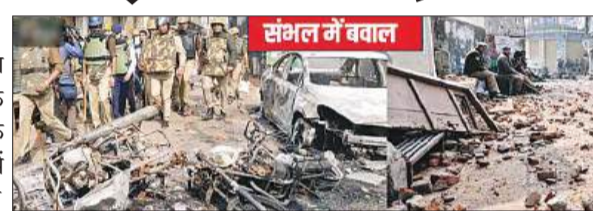
संभल में बवाल। सांसद बर्क और विधायक इकबाल के बेटे पर एफआईआर 2500 दंगाइयों पर केस, दो महिलाओं समेत 25 गिरफ्तार